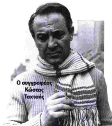
Ο συγγραφέας Κώστας Ταχτοσής

Είναι Αύγουστος του 1988. Για δύο μέρες η Ελπίδα Αρτέμης τηλεφωνεί στον αδελφό της, το συγγραφέα Κώστα Ταχτοσή. Εκείνος, όμως, δεν απαντά, με αποτέλεσμα να πάει από το σπίτι του, στον Κολωνό, για να δει τι συμβαίνει. Ανοίγει με τα κλειδιά που της έχει δώσει ο Ταχτοσής. Το εσωτερικό του σπιτιού αναστατωμένο, σαν να έχουν μπει κλέφτες. Όταν φτάνει στο υπνοδωμάτιο, τον βλέπει γυμνό στο κρεβάτι και, όταν διαπιστώνει πως είναι νεκρός, τηλεφωνεί έντρομη στην αστυνομία. «Όταν έφτασα στο σπίτι της οδού Τηναύου, μπήκα μέσα και είδα τον Ταχτοσή γυμνό, γυρισμένο στη δεξιά πλευρά, με ίχνη αίματος στο πρόσωπο. Στην ντουλάπα του ήταν κρεμασμένα γυναικεία ρούχα, αλλά και περούκες. Ο ιατροδικαστής Μπάμπης Σταμούλης μου είπε πως τον στραγγάλισαν με τα χέρια» περιγράφει ο Πάνος Σόμπολος. Το συγκεκριμένο έγκλημα δεν εξιχνιάστηκε ποτέ, καθώς ο συγγραφέας (που δεν έκρυψε ποτέ την ομοφυλοφιλία του) άργεψε εφήμερους συντρόφους σε στέκια αγοραίου έρωτα, οπότε οι Αρχές δεν μπόρεσαν να κινηθούν προς μια συγκεκριμένη κατεύθυνση. «Το έγκλημα του Ταχτοσή είχε συγκλονίσει την κοινή γνώμη, καθώς ήταν ένας αναγνωρισμένος συγγραφέας με ιδιόρρυθμη προσωπικότητα. Ταυτόχρονα, όμως, ήταν δύσκολο να εξιχνιαστεί, διότι η αστυνομία δεν ήξερε πού να επικεντρώσει τις έρευνές