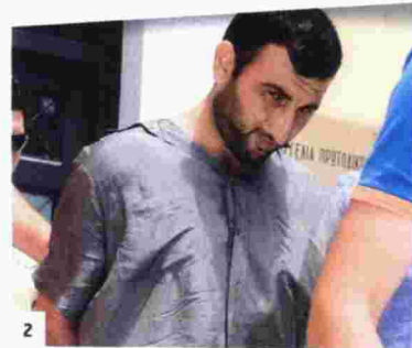
1. Ο θάνατος του Νίκου Σεργιανόπουλου προκάλεσε θλίψη, δάκρυα και πόνο. 2. Ο δράστης David Murtikneli μαχαίρωσε μέχρι θανάτου τον ηθοποιό.