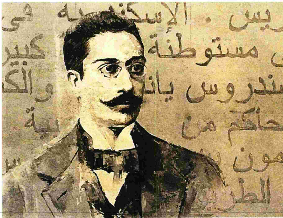
Πορτρέτο του Καβάφη στο Μουσείο Καβάφη στην Αλεξάνδρεια

«Υπάρχει ένα ποίημα από τα Κρυμμένα που έδωσε και το τελικό έναυσμα για να μπω στην περιπέτεια. Έχει τίτλο "Μισή ώρα" και γράφει εκεί: "Αλλά εμείς της Τέχνης/ κάποτε μ' έντασι του νου, και βέβαια μόνο/ για λίγη ώρα, δημιουργούμε ηδονή/ η οποία σχεδόν σαν υλική φαντάζει". Αυτοί οι στίχοι ήταν ο φάρος μου, δεν φώτιζαν απευθείας με τρόπο κραυγαλέο αλλά σαν να χάραζαν αμυδρά τα όρια της πορείας όσο έγραφα».