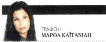
ΓΡΑΦΕΙΗ ΜΑΡΘΑ ΚΑΪΤΑΝΙΔΗ

Τ α παρακάτω ερωτήματα απευθύνονται στους απανταχού γονείς. Πόσα βράδια έχετε κοιμηθεί ήσυχοι χωρίς να νιώθετε τύψεις επειδή χάσατε την ψυχραιμία σας; Ποια ήταν η πρώτη φορά που πιάσατε τον εαυτό σας να νιώθει απερίγραπτη αγωνία επειδή μεγαλώνει και χάνετε τον έλεγχο; Και πότε θα είστε έτοιμοι να του αφήσετε το χέρι ώστε να διασχίσει μόνο του τον δρόμο;