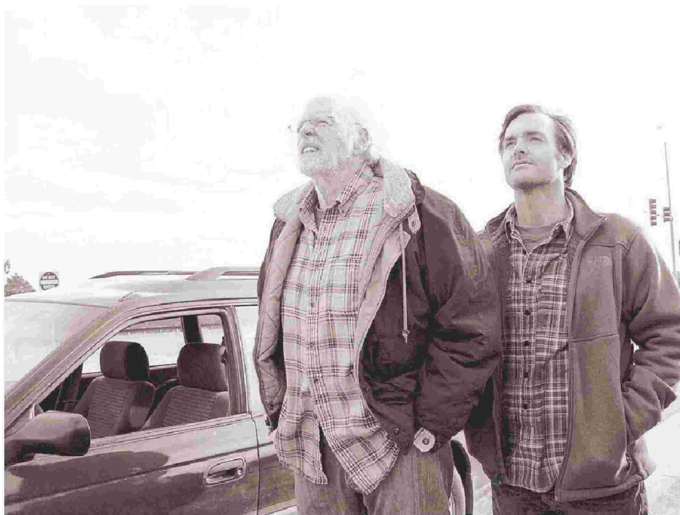
Σκηνή από την ταινία του Αλεξάντερ Πέιν «Νεμπράσκα», όπου σε πρώτο πλάνο βρίσκεται η σχέση πατέρα και γιου.

Κατ' αρχάς ο τίτλος... «Μεγαλώνοντας (με) το παιδί μου» αντί για το σκέτο «μεγαλώνοντας το παιδί μου». Πόσοι γονείς δεν έχουμε νιώσει την αναγκαιότητα αυτής της παρένθεσης, πόσο τεράστια η διαφορά. Ο Κώστας Γκοτζαμάνης, ο οποίος διευθύνει το επιστημονικό θερα-