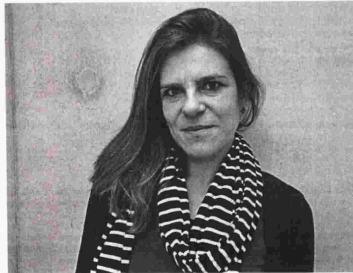
Της Δήμητρας Κολλιιάκου

Δέκα συγγραφείς θα μας συντροφεύουν κάθε Σάββατο με μια καλοκαιρινή ιστορία. Αστικό ή υπαίθριο φόντο, νοσταλγική, ευτράπελη, σαρκαστική, αλλόκοτη ή ενδοσκοπική διάθεση, κείμενα σε τόνους ραστώνης ή θερινής νευρώσης, σκιαγραφούν το γενικό αφηγηματικό πλαίσιο. Δέκα πρωτότυπα μικροδιηγήματα έγραψαν, ειδικά για τους αναγνώστες του «Ανοιχτού Βιβλίου», δέκα σημαντικοί Έλληνες πεζογράφοι. Δέκα συγγραφείς λοιπόν «υπό σκιάν», στον καύσωνα της εποχής και της γραφής.