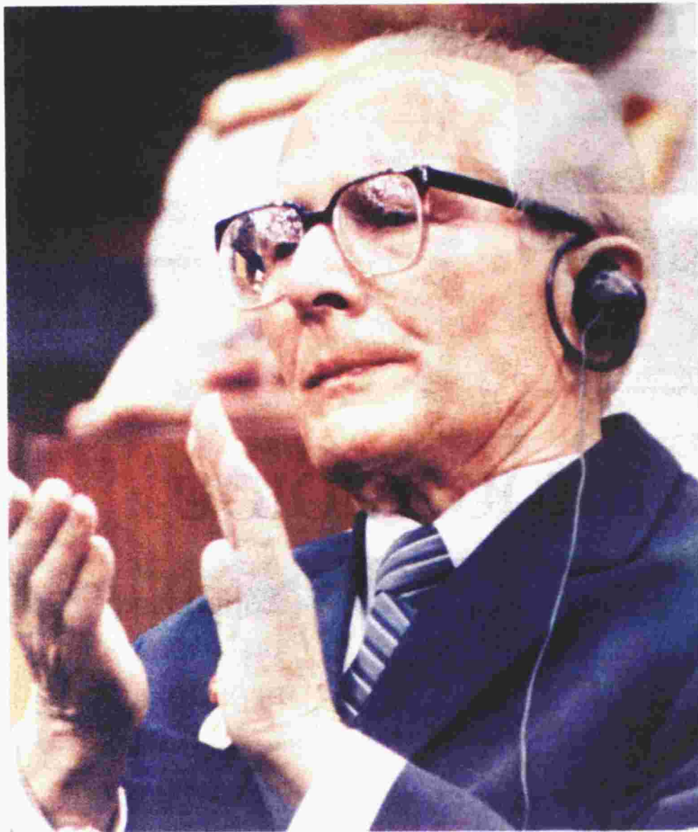
ρημά του με «ήρωα» τον Ε. Χόνκερ