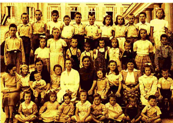
Φεθνομαζωμα. Παιδιά από το Κερασόβο (πάνω φωτο.) και Παδικός Σταθός (κάτω φωτο.), 1950. (Από τον τόμο «Παιδομαζωμα ή Παιδοσωτισμός»)