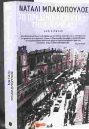
Η ΝΑΤΑΛΙ ΜΠΑΚΟΠΟΥΛΟΣ ΚΑΙ ΤΟ ΕΞΩΦΥΛΛΟ ΤΟΥ ΒΙΒΛΙΟΥ ΤΗΣ.

Κ άθε βράδυ έπλενες τα δόντια σου και έβαζες κρέμα στο πρόσωπό σου με το φόβο ότι μπορεί να σε συλλάβουν μέσα στη νύχτα. Αυτά τα πράγματα άλλαζαν όντως τη ζωή. Η απουσία και μόνο μπορούσε να σε σκοτώσει».