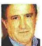
Γράφει ο Γιώργος Λακόπουλος