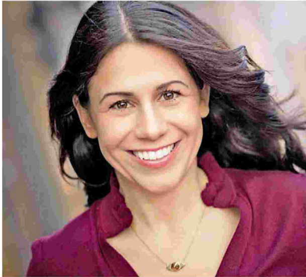
Η συγγραφέας Νάταλι Μπακόπουλος αγάπησε την Ελλάδα και τη φιγούρα του αδελφού της γιαγιάς της, ποιητή Μιχάλη Κατσάρου.