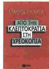
Σταύρος Λυγερός ΑΠΟ ΤΗΝ ΚΛΕΙΠΤΟΚΡΑΤΙΑ ΣΤΗ ΧΡΕΟΚΟΠΙΑ Εκδ. Πατάκη