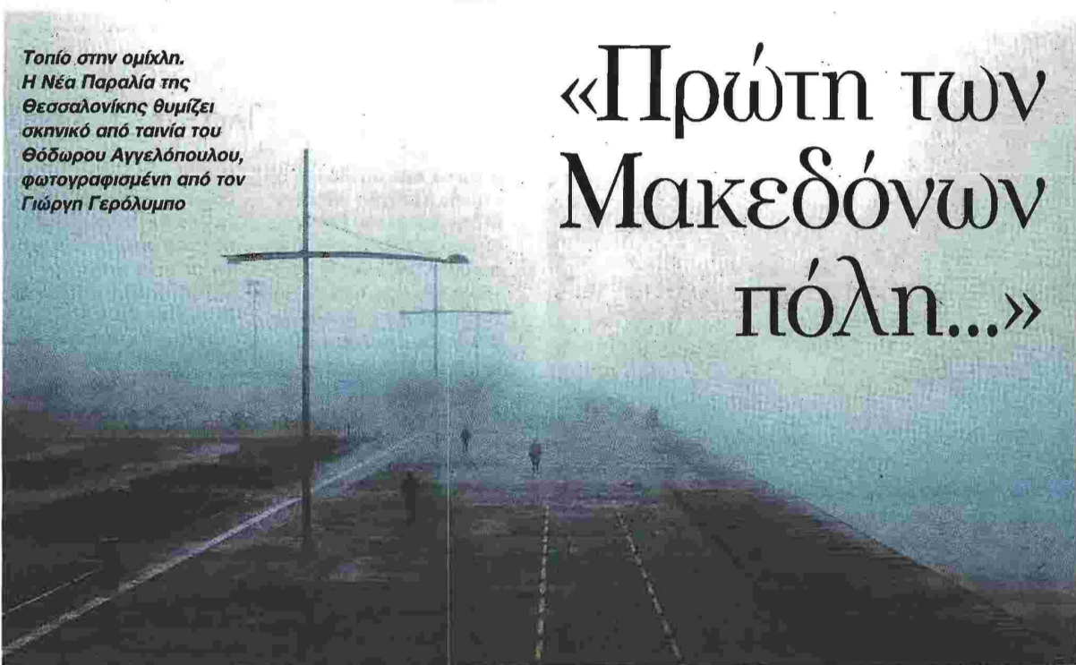
Τοπίο στην ομίχλη. Η Νέα Παραλία της Θεσσαλονίκης θυμίζει σκηνικό από ταινία του Θόδωρου Αγγελόπουλου

Ακολουθεί το ιστορικό κέντρο όπου συνυπάρχουν κτίρια-μνημεία οθωμανικής προέλευσης όπως το Αλατζά Ιμαρέτ στην Κασσάν-