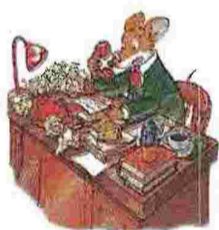
GERONYMO STILTON, «Ο ΜΥΣΤΗΡΙΩΔΗΣ ΚΛΕΦΤΗΣ ΤΟΥ ΤΥΡΙΟΥ», ΚΕΔΡΟΣ