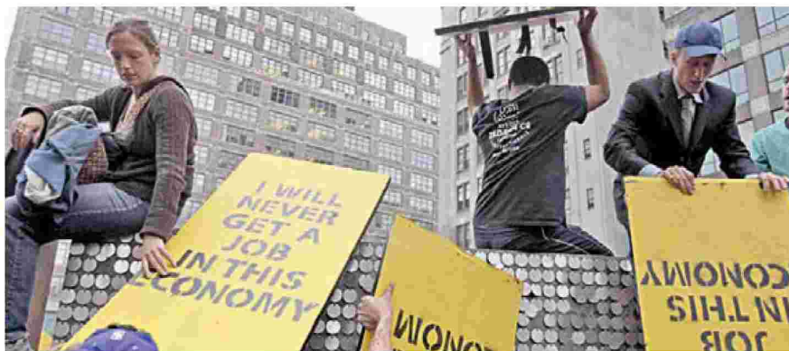
Οι δρόμοι γύρω από τη Wall Street ήταν τον τελευταίο καιρό όχι το κέντρο του εμπορίου αλλά το κέντρο του ακτιβισμού.

τιά της τάσης που ξεκίνησε όταν άρχισε ν' ακνοφαιίνεται η οικονομική κρίση. Μια τάση που συνεχίζεται με αμείωτο ρυθμό. Ελληνες και ξένοι αναλυτές, οικονομολόγοι, φιλόσοφοι, πολιτικοί, δημοσιογράφοι διαρκώς γράφουν βιβλία που απαντούν στην κρίση, στα αίτιά της, στις προοπτικές εξέδου. Κι όσο για τους εκδότες, ευχαρίστως αναλαμβάνουν το κόστος και το εκδοτικό ρίσκο, αφού είναι τα μόνα βιβλία που πουλάνε πολύ αυτό τον καιρό. Μερικά παραδείγματα: στις