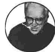
Από τον Κωστή Παπαγιώργη