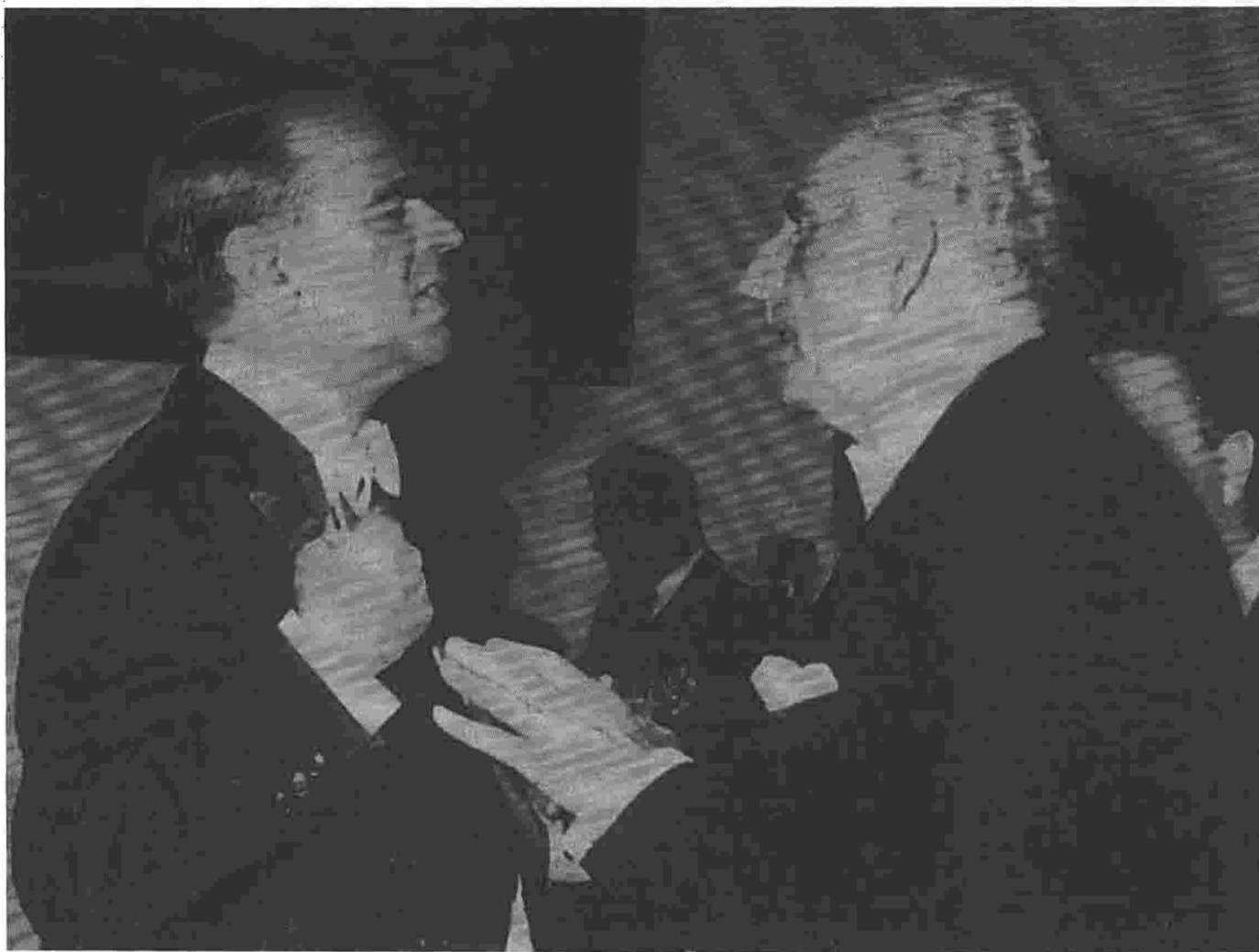
Ο Κωνσταντίνος Καραμανλής και ο Γεώργιος Παπανδρέου.

την ευθύνη της κομμουνιστικής Αριστεράς για την αποτυχία του «ρεύματος» να επιτελέσει τον μεταρρυθμιστικό του ρόλο υπό την ηγεσία του Παπανδρέου την επομένη της απελευθέρωσης. 1 Στις επιλογές του ΕΑΜ/ΚΚΕ χρεώνει, επίσης, μια ακόμα ανασταλτική εξέλιξη για την πορεία του «ριζοσπαστικού ρεύματος», την πολιτική αναζωογόνηση των προπολεμικών παρατάξεων του Διχασμού, οι οποίες αποδείχθηκαν, έστω και πρόσκαιρα, ασυναγώνιστοι δίαυλοι πατριωτικής-προστασίας (σ. 171).