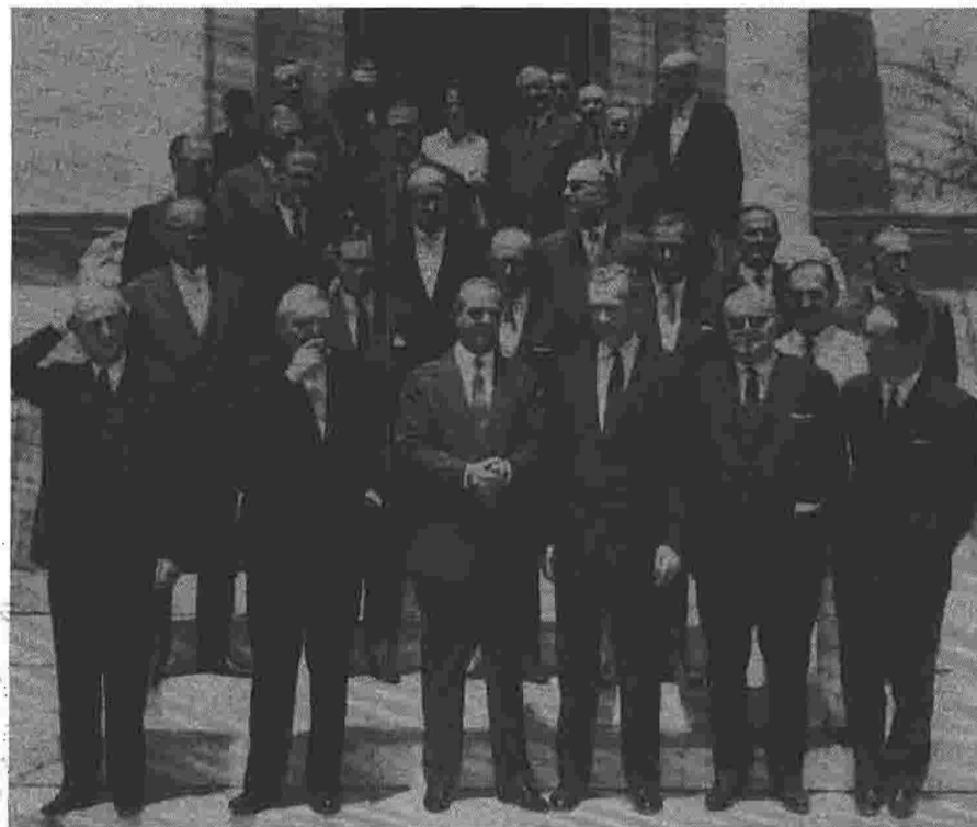
Ο Κωνσταντίνος Καραμανλής και ο αντιπρόεδρος της κυβέρνησής του Παναγιώτης Κανελλόπουλος (πρώτος από αριστερά) έχοντας ανάμεσά τους τον αντικαγκελάριο της Δυτικής Γερμανίας Λούντβιχ Έρχαρντ μαζί με αντιπροσωπεία Ευρωπαίων επισήμων κατά την επίσκεψή τους για την υπογραφή του πρωτοκόλλου της Συμφωνίας Σύνδεσης της Ελλάδας με την Ευρωπαϊκή Οικονομική Κοινότητα (ΕΟΚ), την οποία τότε αποτελούσαν έξι χώρες. Η τελετή υπογραφής έγινε στις 9 Ιουλίου 1961. Δεύτερος από δεξιά ένας από τους αρχιτέκτονες της ευρωπαϊκής ενοποίησης, ο Βέλγος υπουργός Εξωτερικών και Πωλ Ανρ΄ Σπάακ. Πίσω του διακρίνεται ο υπουργός Εξωτερικών Ενώγγελος Αβέρωφ.

Πέραν αυτών των επισημάνσεων, ο συγγραφέας δεν προχωρά στη διερεύνηση του εθνικισμού ως στοιχείου της ιδεολογικής συγκρότησης αλλά και της πολιτικής πρακτικής των φορέων του «ρεύματος»