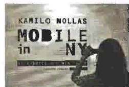
Kamilo Nollas MOBILE IN NY Εκδ. Καστανιώτη

Γεννημένος στο Μανχάταν το 1941, ο Άλαν Φερστ έζησε για μεγάλο διάστημα στο Παρίσι και τη Νότια Γαλλία, όπου και δίδαξε στο Πανεπιστήμιο του Μονπελιέ ενώ έχει επίσης συνεργαστεί ως δημοσιογράφος με το περιοδικό «Esquire» και την «International Herald Tribune». Το πρώτο του μυθιστόρημα «Οι στρατιώτες της νύχτας» (Night Soldiers) εκδόθηκε το 1988 για να ακολουθήσουν άλλα εννιά τα οποία τον καθιέρωσαν ως συγγραφέα ειδικευμένο στα ιστορικά κατασκοπευτικά μυθιστορήματα.