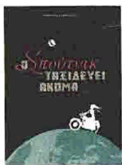
Γιώργος Καγγελάρης Ο ΣΠΟΥΤΝΙΚ ΤΑΞΙΔΕΥΕΙ ΑΚΟΜΑ Εκδ. Μοντέρνοι Καιροί

Η Καλυψώ, μια 35χρονη απόφοιτος του Πάντειου και «όψιμη σπουδαστρια πιάνου», προσπαθώντας να ξεκόψει από το φοιτητικό της παρελθόν αποφασίζει να μετακομίσει από την Καλλιθέα στο Παγκράτι. Στο καινούργιο της διαμέρισμα, η ανήσυχη νεαρή σε αναζήτηση ενός βαθύτερου νοήματος στη ζωή της, θα ανακαλύψει ξεχασμένα κάποια νεανικά ημερολόγια τα οποία παραπέμπουν στην πολυτάραχη δεκαετία του '60. Μια παρέα παιδιών με βάση το Παγκράτι εκείνης της εποχής βιώνουν την εφηβεία τους με τέτοιο τρόπο ώστε εμπνέουν στην Καλυψώ ένα μυθιστόρημα. Πρώτο μέρος της τριλογίας «Πυκνός χρόνος» (οι επόμενοι αναμένονται), «Ο Σπούτνικ...» στοχάζεται το αναπόφευκτο ταξίδι της ζωής.