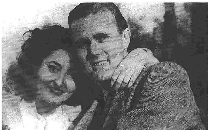
Το κλίμα της «εποχής των κατασκόπων» στη Θεσσαλονίκη προετοίμασε το έδαφος για τη δολοφονία λίγα χρόνια αργότερα - το 1948 - του Τζορτζ Πολκ. Στη φωτογραφία ο αμερικανός δημοσιογράφος με την ελληνίδα σύζυγό του, την αεροσυνοδό Ρέα Κοκκάνη

Εκεί τοποθετεί τη δράση του αστυνομικού μυθιστορημάτος του ο Άλαν Φερστ, ο οποίος ερήμην του σκοτεινού ιστορικού της θεσσαλονικιάς αστυνομίας με τους διάφορους Μουσουχυνήδες, καταδότες, δωσίλογους και μαυραγορίτες διαλέγει ως πρωταγωνιστή του έναν φιλοεβραίο συνεργάτη των βρετανικών μυστικών υπηρεσιών, έντιμο, ευφυή και αλτρουιστή έλληνα αστυνομικό που πα-