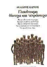
Θόδωρος Καρζίζης ΓΛΥΚΟΠΙΚΡΑ ΔΙΣΤΙΧΑ ΚΑΙ ΤΕΤΡΑΣΤΙΧΑ Εκδ. Καστανιώτη

Ο δημοσιογράφος, λογοτέχνης και ιστορικός Θόδωρος Καρζίζης σπικουραεί κυριολεκτικά επί παντός επιστητού και μας προσφέρει 121 μετρικά ομοιοκατάληκτα δίστιχα και τετραστίχα για τα ονειράτα και το χρήμα, για το στομάχι και το εγώ, για της ευτυχίας του μυστικό, για τον γλάρο και τη μοναξιά, για την αστραπή και για τη συντροφιά με τη σιωπή, για τη διά βίου μάθηση και για μια στιγμή. Χωρισμένα από τον συγγραφέα σε πέντε κατηγορίες – για τον πλούτο και τη φτώχεια, για την ευτυχία και τη δυστυχία, για τον πόλεμο και την ειρήνη, για τα εγκόσμια και τα υπερκόσμια και μερικά απλώς για να γελάσουμε λίγο – τα «γλυκοπικρά» του Καρζί εκφράζουν εν τέλει την ίδια τη ζωή.