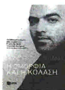
Ρομπέρτο Σαβιάνο Η ΟΜΟΡΦΙΑ ΚΑΙ Η ΚΟΛΑΣΗ ΜΤΦ. ΜΑΡΙΑ ΟΙΚΟΝΟΜΙΔΟΥ, ΕΚΔ. ΠΑΤΑΚΗΣ 2011, ΣΕΛ. 345

Τέλος, παρά τον θερμισμό και την αυτοεπίδειξη που χαρακτηρίζει τα πρώτα κεφάλαια, το βιβλίο περιλαμβάνει και εξαιρετικά δοκίμια για τους λογοτεχνικούς ήρωες του Σαβιάνο (λ.χ., τον Ισαάκ Μπασέβιτς Σίνγκερ ή τον Σάλμαν Ρούσκι και τον Ουίλιαμ Βόλμαν) αλλά και τον Λιονέλ Μέσι ή τη Μίριαμ Μακέμπα που κατάφεραν να υπερκεράσουν θεούς και δαίμονες. Είναι προφανές ότι ο Σαβιάνο αντιλαμβάνεται τη γραφή ως ένα είδος προσωπικού έπους.