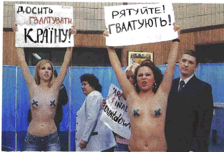
Ουκρανές φεμινίστριες διαμαρτύρονται σε εκλογικό κέντρο. Η Έμμα Γκόλντμαν σελίδα σελίδα ξητινάζει τη στρεβλή χειραφέτηση της γυναίκας – που, αν επιθυμεί να είναι ελεύθερη, πρέπει να χειραφετηθεί από τη χειραφέτηση!

Ο περιπετειώδης βίος της Έμμα Γκόλντμαν και τα επαναστατικά της πράγματα είναι δεδομένα. Γεννημένη στη σημερινή Λιθουανία, δεν άργησε να ασπαστεί τις αντικαθεστωτικές ιδέες στην προκτωβριανή Ρωσία, μετανάστευσε στην Αμερική ενώ το 1901 σε νεφελή στο Σικάγο κατηγορούμενη για τη δολοφονία του προέδρου Τουλιάμ Μακίνλι. Η πολιτική της δράση – ατάλαντη μέχρι τέλους αλλά και με κριτική στάση απέναντι στο σοβιετικό οικοδόμημα – δεν περιορίστηκε στις δομικές διεκδικήσεις για εργασία και κοινωνική δικαιοσύνη αλλά περιέλαβε στην επαναστατική της αιτιότητα το γυναικείο ζήτημα, την αντιούληψη (υπέρ μέχρι τέλους) και την ισότητα των δύο φύλων. Ως εδώ καλά, όμως στην περίπτωση της – και με ασορμή το υπέροχο κείμενο που ξαναφέρει στο φως ο εκδοτικός οίκος Ποταμός και η φροντίδα της Κατερίνας Σκανά, η οποία το προλογίζει έξοχα και το μεταφράζει – υπάρχει ένα ιδιαίτερο στοιχείο που αξίζει να