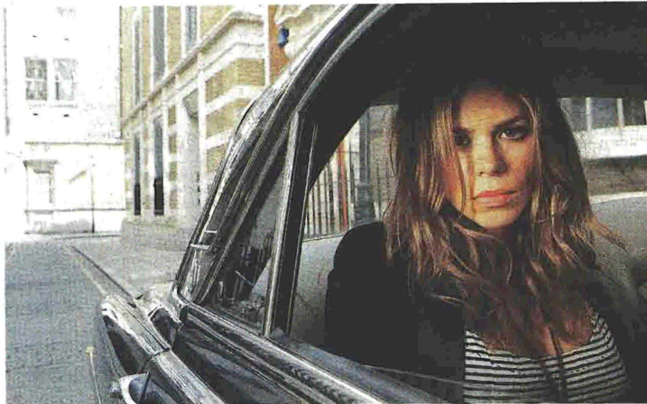
Η Μπλι Πάιπερ στη βρετανική σειρά «Το μυστικό ημερολόγιο ενός κολ γκερλ», που είναι βασισμένη σε ένα βιβλίο ανάλογο με εκείνο της Ελπίδας Σ.

« Ε χοντας κάνει σεξ επί πληρωμή με περισσότερους από τριακόσιους άνδρες μέσα σε δύομισι χρόνια, ξέρω πια πολύ καλά ότι τα σημαντικότερα πράγματα στο σεξ κινούνται γύρω από το σεξ» δηλώνει η Ελπίδα Σ. Είναι ένα πρώην κολ γκερλ, λίγο πριν από τα τριάντα, με πτυχία Ψυχολογίας στο Ρέθυμνο και τη Σορβόνη. Αποφάσισε να γράψει για την εμπειρία της με τους άνδρες όχι ακριβώς στο κρεβάτι αλλά στο πεδίο της συμπεριφοράς, προσπαθώντας να περιγράψει τον τρόπο με τον οποίο προσεγγίζουν, φλερτάρουν, χειρίζονται την επιθυμία τα δύο φύλα. Το εγχείρημα, για τα ελληνικά δεδομένα, είναι καινοφανές. Αντίθετα στον αγγλοσαξονικό κόσμο βλέπουμε αρκετά πρώην κολ γκερλ να γράφουν βιβλία, στήλες σε εφημερίδες και να γίνονται μιλώγκερ. Παράδειγμα η «Belle de jour», που έγραψε το «Secret Diary of a Call Girl» και στα 34 της ασόκλαμπε την αληθινή της ταυτότητα (γεννήθηκε στη Φλόριδα και έγινε κολ γκερλ στο Λονδίνο), καθώς και το γεγονός ότι διαθέτει διδακτορικό στις επιστήμες της υγείας, στον τομέα