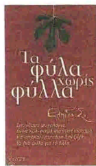
Ελπίδα Σ. ΤΑ ΦΥΛΑ ΧΩΡΙΣ ΦΥΛΛΑ Εκδ. Τόπος

της γενετικής επιδημιολογίας. Δύο της βιβλία έγιναν μπεστ σέλερ και τηλεοπτικό σίριαλ. Στα ίδια βήματα, η Ελπίδα Σ. έγραψε το πρώτο της βιβλίο και άνοιξε μπλογκ - ο εκδότης περιγράφει στην εισαγωγή πως πήγε η ίδια στον εκδοτικό οίκο και παρέδωσε τα χειρόγραφα. Στο βιβλίο της, με τον εύληπτο τίτλο «Τα φύλα χωρίς φύλλα», αποκαλύπτει ότι γνώρισε το επάγγελμα μέσω γνωστών της σεξβιτόρας σε μπαρ και υποσχέθηκε στον εαυτό της - υπόθεση που πήρσε - να κάνει αυτή τη δουλειά για περιορισμένο χρονικό διάστημα, με σκοπό να συγκεντρώσει κάποια χρήματα. «Στην εισαγωγή μας ασχολούμαστε πολύ με το σεξ, σημειώ ότι δεν το ευχαριστούμαστε» λέει. Προσθέτει δε και πολλά άλλα: «Η διεγερτικότερη σεξουαλική φαντασία