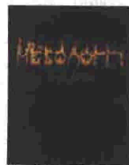
«ΜΕΣΟΛΟΓΙΟ - ΙΕΡΗ ΠΟΛΗ». Εκδ. «Διέξοδος», σελ. 185, € 70,00.

και σκίτσα, και αναλυτικά κείμενα, τα πάντα για την πεζοπορία: Ορεινό περιβάλλον, περιβαλλοντική και ορειβατική ηθική, ορειβατικός εξοπλισμός, προσαρμοστικός, διατροφή και μετεωρολογία, τεχνικές και τακτικές πεζοπορίας σε ξερό έδαφος ή χιόνι - πάγο, διαμονή στην ύπαιθρο, ορειβατικά καταφύγια, συνοδεία ομάδας, κίνδυνοι στο βουνό και αντιμετώπιση τους αναπτύσσονται αναλυτικά και διεξοδικά στο βιβλίο, μαζί με τις απαιτούμενες πρώτες βοήθειες και την πιθανή διάσωση τραυματία. Ενώ, παράλληλα, αληθινές ιστορίες από την ορειβατική εμπειρία των συγγραφέων καθιστούν ακόμα θελκτικότερο όχι μονάχα το εγχείρημα, αλλά αυτή καθυπαύτη την αναρρίκηση ή την πεζοπορία. Προτάσσοντας φυσικά τον «δεκάλογο του σωστού ορειβάτη», οι συγγραφείς υπενθυμίζουν το ότι τα βουνά ασκούν πάντοτε μια απαράμιλλη γοητεία. Ως κατοικία των Θεών και πατρίδα των θρύλων, απαγορευμένη για χρόνια στους κοινούς θνητούς. Η ορειβάσις, εξάλλου, ασμιν το ξεκινάμε, αποκαλύπτει χαρακτηριστικά και δημιουργεί ισχυρούς δεσμούς και φιλίες.