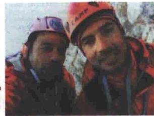
Όλα όσα πρέπει να γνωρίζει κανείς για την πεζοπορία κατέγραψαν οι Χρήστος Μπελογιάννης - Γιώργος Βουτυρόπουλος.