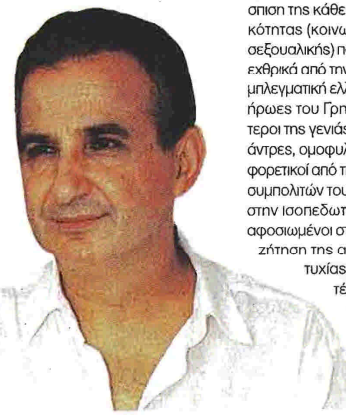
Το νέο βιβλίο του Θεόδωρου Γρηγοριάδη είναι ένα μυθιστόρημα ερωτικό με την ιστορία και την πολιτική στο φόντο

κρυμμένα. Επίσης, με την ενσωμάτωση του βιβλίου του Διονύσιου μέσα σε εκείνο του Γρηγοριάδη, το μυθιστόρημα του δεύτερου αναδεικνύεται σε ένα ειρωνικό μεταμυθολογικό αφήγημα που ταλαντώνεται ανάμεσα στην αφηγημένη πραγματικότητα και τη μυθολογική μεταμόρφωσή της. Στο Ο παλαιστής και ο δερβίσης αναγνωρίζονται οι σταθερές που συνεχούν το παλαιότερο αφηγηματικό έργο του συγγραφέα, δηλαδή η ανάδειξη του ξεχωριστού πολιτισμικού στίγματος του βορειοθρακικού χώρου και η υπεράσπιση της κάθε είδους διαφορετικότητας (κοινωνικής, εθνοτικής, σεξουαλικής) που αντιμετωπίζεται εκθρακτικά από την υποκοπή και αμυλεματική ελληνική κοινωνία. Οι ήρωες του Γρηγοριάδη, οι καλύτεροι της γενιάς του, γυναίκες και άντρες, ομοφυλόφιλοι και μη, διαφορετικοί από τη μεγάλη μάζα των συμπολιτών τους που βουλιάζουν στην ισοπεδωτική ομοιομορφία, αφοσιωμένοι στην ατέρμονη αναζήτηση της αγάπης και της ευτυχίας, μας αφήνουν εν τέλει την πικρή γεύση της θλίψης για την Ελλάδα-καμένη πατρίδα που χαράμίζει τα καλύτερα παιδιά της.