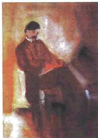
Έργο της Μαργαρίτας Μνακοπούλου

Μόλις το 1993 εκδίδεται μια πρώτη θεματική συλλογή που ξεφεύγει από τον κανόνα του εορταστικού διηγήματος. Είναι τα «Διηγήματα της αγάπης», επιλεγμένα από τον ζωγράφο Γιώργο Κόρδη, ο οποίος και τα εικονογράφει. Ο ίδιος, το επετειακό 2001, εκδίδει τη συλλογή «Δυναίκες της προσημνίας και του καμμού», αναδεικνύοντας ζωγραφικά, με μοναδικό τρόπο, τις, κατά τον Ζήσιμο Λορεντζάτο, «Ρωμιές» του Παπαδιαμάντη. Εκείνη τη χρονιά, ορισμένοι «πιστοί» του Σκιαθίτη ανθολογούν και πάλι διηγήματά του, σύμφωνα με το προσωπικό τους γούστο. Μεταξύ αυτών, μια ανθολογία διακρί-