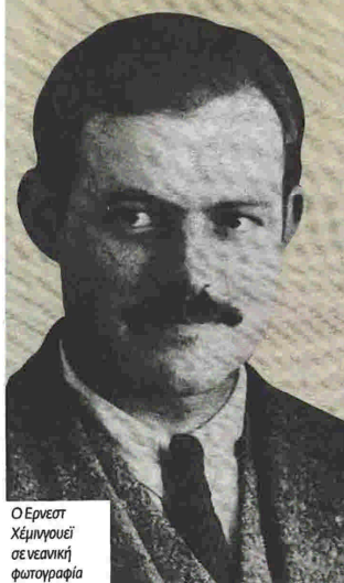
Ο Έρνεστ Χέμινγουεϊ σε νεανική φωτογραφία