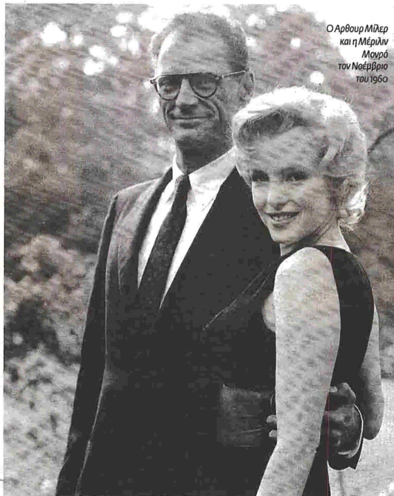
Ο Άρθουρ Μίλερ και η Μέριλιν Μονρό τον Νοέμβριο του 1960

Ο Μέγερ αναδημιουργεί τη σχέση Μίλερ - Μονρό και μέσα από αυτή μια κρίσιμη εποχή για την αμερικανική κουλτούρα και τον κόσμο του θεάματος. Στο βιβλίο του παρελαύνουν πλήθος διασημοτήτων. Από τον Ιβ Μοντάν και τον Κλαρκ Γκέμπλ ως τον Μπίλι Γουάιλντερ και τον Σολ Μπέλοου. Ανακαλεί μια ολοκληρωμένη εποχή με τρόπο άμεσο και η αφήγησή του αποπνέει την πικρή γοητεία της.