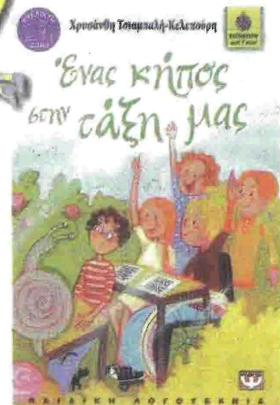
Συγγραφέας: Χρυσάνθη Τσιμπανλή-Κελεπούρη «Ένας κήπος στην τάζη μας» Εικόνες: Ναταλία Καπατσούλια Εκδόσεις: ΨΥΧΟΠΟΙΣ