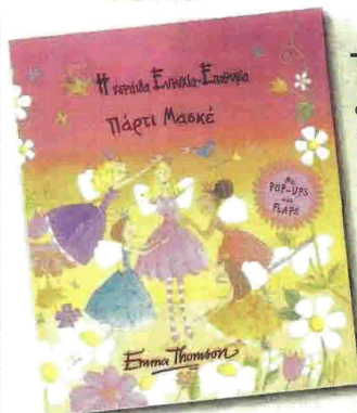
Συγγραφέας: Έμα Τόμσον «Η νεράδα Ευτυχία-Επιθυμία Πάρτι Μασκέ» Εικόνες: Έμα Τόμσον Εκδόσεις: Α.Α. ΛΙΒΑΝΗ

Το υπέροχο πάρτι μασκέ της Ευτυχίας-Επιθυμίας το περιμένει ανυπόμονα όλο το σχολείο. Όμως το θέμα του Πάρτι είναι λίγο ασυνήθιστο: η φύση! Όλοι γελάνε με το θέμα, σκέφτονται ζώα και λουλούδια, άλλοι τη θάλασσα και τα βουνά. Οι φιλενάδες της Ευτυχίας-Επιθυμίας δεν μπορούν να σκεφτούν τι να φορέσουν, μέχρι που εκείνη θα καταφέρει να τις κάνει να ανοίξουν τα μάτια τους και να δουν την εκπληκτική φύση που τις περιβάλλει. Η έμπνευση έρχεται από τον ουρανό, από τη γη, από τα χρώματα, τα αρώματα, αυτά που βλέπουμε γύρω μας όταν ξυπνάμε το πρωί. Η Έμα Τόμσον είναι η δημιουργός της πολυαγαπημένης Ευτυχίας-Επιθυμίας και των παιδικών εικονογραφημένων «Η Φίλι και ο Πάντα» και «Τα παιχνίδια της Λου».