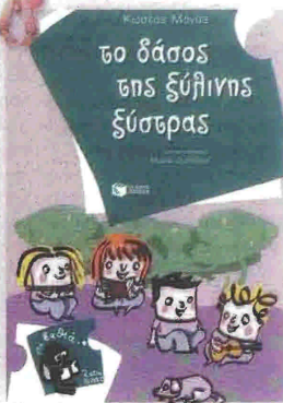
Συγγραφέας: Κώστας Μάγος «Το δάσος της ξύλινης ξύστρας» Εικόνες: Μιρτά Δεληβοριά Εκδόσεις: ΠΑΤΑΚΗ

Η ξύστρα του Τάκη δεν ήταν σαν τις άλλες. Κάθε φορά που την έβγαζε από την κασετίνα του, μοσχοβολούσε η τάζη άρωμα κέδρου. Εκτός από τη μυρωδιά, όμως, η ξύστρα ξεχώριζε από τις άλλες και για τον ήχο της. Όταν έβαζες το αυτί σου εκεί που μπαίνει το μολύβι, άκουγες όλους τους ήχους από το δάσος των κέδρων. Αλλά τις τελευταίες μέρες κάτι έπαθε η ξύστρα κι έχασε τις ιδιαίτερες δυνατότητές της. Οι μέρες περνούσαν, αλλά το μυαλό του Τάκη ήταν στην ξύστρα, που άρχισε να βγάζει ένα περίεργο ήχο «σαν αυτόν που κάνουν τα ξύλα όταν καίγονται». Προσπαθώντας να μάθει περισσότερα, ο Τάκης καταφεύγει στο δάσος. Διασκεδαστική ιστορία, με οικολογικά μηνύματα και δημιουργικές δραστηριότητες στο τέλος του βιβλίου.