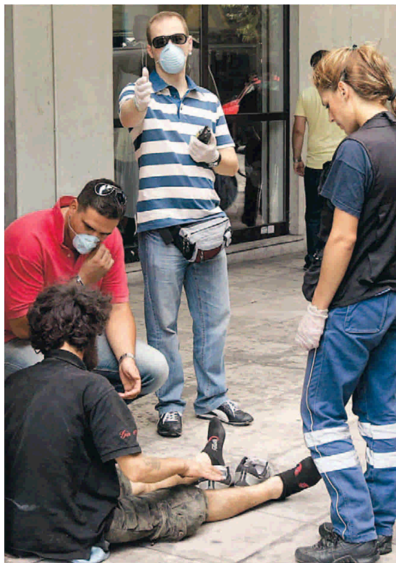
Μία από τις συνηθισμένες σκηνές που συμβαίνουν στην πίσω όψη της Αθήνας.

Τέτοιες περιγραφές θα βρει πολλές ο αναγνώστης στο νέο μυθιστόρημα της Ερως Σωτηροπούλου « Εύα » (εκδ. Πατάκης). Με περιγραφές ανάλογες ή πιο αιχμηρές, πάντοτε ρεαλιστικές και μαζί ποιητικές-όπως έχουμε συνθιβάσει να είναι το πεζογραφικό ύφος της Ερως Σωτηροπούλου-, επιλέγει να παρακολουθήσει την κίνηση μιας νέας γυναίκας στους δρόμους της πίσω όλης της Αθήνας. Στους δρόμους που είναι λεροί, σκοτεινοί, γεμάτοι οργανικά σκουπίδια ή απλώς ανθρώπινα ράκη. Για την ακρίβεια επιλέγει