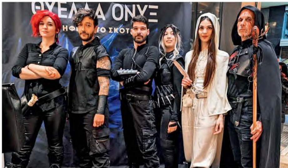
Στην εκδήλωση που πραγματοποιήθηκε για την κυκλοφορία του βιβλίου «Θύελλα Ονύξ» της Ρεμπέκα Γιάρος, στον χώρο των εκδόσεων Διόπτρα, το «παρών» έδωσαν και cosplayers, με στολές εμπνευσμένες από τον κόσμο που έχει φτιάξει η Αμερικανίδα συγγραφέας.

Στην Ελλάδα, οι τίτλοι της σειράς «The Emrys» έχουν φτάσει σε πωλήσεις τα 50.000 αντίτυπα. Έχουν μεταφραστεί σε περισσότερες από 30 γλώσσες και κάθε βιβλίο της σειράς έγινε No 1 best seller των New York Times. «Παρότι πριν από είκοσι χρόνια μια τέτοια κυκλοφορία θα φάνταζε επιχειρηματικά επικίνδυνη στην Ελλάδα, πλέον όλο και περισσότερος κόσμος στρέφεται στα παραμυθιακά μοτίβα, στις αγωνιώδεις περιπέτειες και στους παθιασμένους έρωτες του συγκεκριμένου είδους, προκειμένου να γίνουν μέρος ενός μύθου», σημειώνει η Λύντι Γαλάτη, editorial director των εκδόσεων Διόπτρα. «Προς το παρόν, το romantasy έχει κερδίσει το νεότερο κοινό, ηλικίας 15-35, με μια ισχυρότερη τάση προς τις γυναίκες αναγνώστριες, ωσό-