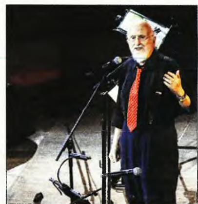
Ο Διονύσης Σαββόπουλος πέρνει τον Ιούλιο στο Ηρώδειο.

λωσα και θα 'θελα να δω πώς ήμουν πιστο-ρίκος, πώς φέρθηκα στον επαγγελματικό μου βίο, πώς ήμουν σαν σύζυγος, πατέρας και παππούς, κι ακόμα πώς ήμουν σαν πολίτης, σαν φίλος και σαν γιος. Σ' αυτά είναι καλός ο Σάββο. Το 'χει. Σαν ρόλος, και σουξέ είχε και πείρα διαθέτει. Τώρα ο ρόλος θα μιλήσει για τον δημιουργό του. Ενα παιχνίδι είναι. Ενα κόλπο. Ελπίζω να το βρείτε διασκεδαστικό. Σε αυτό το βιβλίο ο Σαββόπουλος μιλάει για τον Νιόνιο. Αυτόν ντύνεται. Καλή ακρόαση, αγαπητοί μου, καλή ανάγνωση. Δ.Σ.».