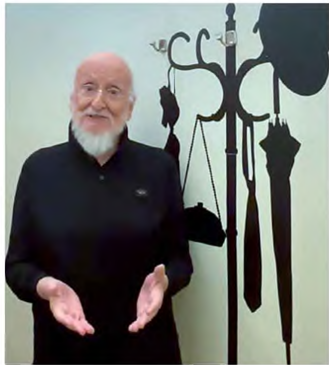
Ο Διονύσης Σαββόπουλος, τον Δεκέμβριο 2024.

Κανένας καλλιτέχνης δεν βγαίνει με παρθενογένεση. Όλοι έχουν επιρροές. Και σχέσεις που τους διαμορφώνουν. Στο βιβλίο αναφέρονται (ή τεκμαίρονται) πολλές, ωστόσο τρεις είναι εκείνοι που αναφέρονται από τον Διονύση Σαββόπουλο ξεχωριστά – «πάνω από όλους», όπως λέει— ως δάσκαλοι του: ο φιλόλογος καθηγητής του κ. Βαφειάδης, στον οποίο μάλλον στέλνει χαιρετίσματα από το εξώφυλλο των Αχαρνέων , «διότι με έκανε καλόν στ' Αρχαία»· ο ποιητής Νίκος-Αλέξης Ασλάνογλου, «με τη χαμηλόφωνη και παθιασμένη ποίησή του» με τον οποίο είχε πολλές, θα 'λεγε κανείς, απελευθερωτικές εμπειρίες («Δυσκολεύομαι να αφεθώ. Γενικά το λέω», γράφει αλλού), τις οποίες περιγράφει κάνοντας την επαν-ακρόαση της «Θανάσιμης μοναξιάς του Αλέξη Ασλάνογλου» μια φρέσκια εμπειρία (Κι έτσι εδώ σε ξαναβρίσκω Αλέξη πες μου / Αλέξη πες μου αν με θυμάσαι / το καλοκαίρι έχει τελειώσει / από καιρό έχει τελειώσει / τι ζητάς)· και τον Μάνο Χατζιδάκι, αναφερόμενος στη μουσική ιδιοφυΐα του που τον έκανε να διαλέξει τον προσωπικό του δρόμο και να εκτιμήσει την ελληνική μουσική παράδοση αιώνων, και που άγγιξε την ψυχή του όχι μόνο στα εφηβικά του χρόνια, αλλά και διαρκώς αργότερα. Με τον Μάνο (έτσι τον αποκαλεί) ήταν μέχρι το τέλος και μας διηγείται συγκινητικά την προετοιμασία για να δεχτεί το θανάτο