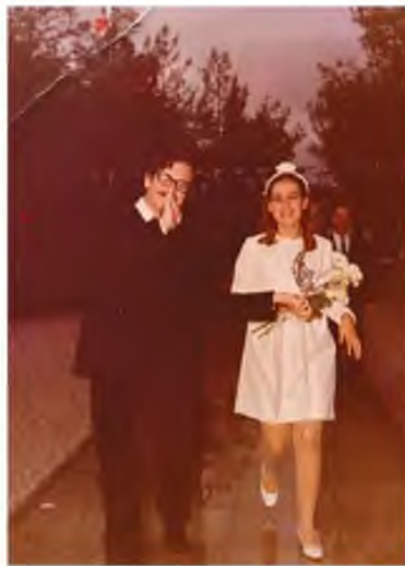
ΝΙΟΠΑΝΤΡΟ ΖΕΥΓΑΡΙ ΜΕ ΤΗΝ ΑΣΠΑ

που αναγκάστηκε να κάνει στα δύσκολα, π.χ. το γυμνό μοντέλο στην Καλών Τεχνών, οι συναντήσεις με άλλες σπουδαίες μορφές όπως ο Χατζιδάκις ή ο Κατσιμπαλης, ενώ φωτίζονται με τον πιο τρυφερό τρόπο οι στιγμές με τον Λουκιανό Κηλαηδόνη, το αμερικανάκι της καρδιάς του, τον Μάνο Λοΐζο και τους μουσικούς του, π.χ. τον Πάνη Μπαχ-Σπυρόπουλο. Σάμπως οι μεγάλες στιγμές των γεμάτων σταδίων, των βραβείων και των επιτυχιών να περνούν σε δεύτερη μοίρα («Ο Θεός να μας φυλάει από τα σουξέ», γράφει σε σχετικό κεφάλαιο του βιβλίου). Άλλωστε, καλή η καριέρα και θεϊκό το έναυσμα που φέρνει η επαφή με τη δημιουργία, αλλά τι συμβαίνει όταν η ένθεη μούσα είναι ένα απλό βατράχι –αναφέρεται με τρυφερότητα στη σχετική ομολογία του Ζαμπέτα– και ο ίδιος ένας βασιλιάς που παρέμεινε γυμνός; Η συντριπτική, στο τέλος του βιβλίου, εικόνα, με τον συνθέτη που μένει άρρωστος και ολόγυμνος, έχοντας μόλις βρέξει την πιτζάμα του, μπροστά στη νανοκόμα, κατά την πρόσφατη περιπέτεια της υγείας του, είναι η πιο δοξαστική στιγμή στην αφήγηση του Σαββόπουλου και η ομολογία της πιο αδιαφιλονίκητης ήττας του, που είναι η ίδια η θνητότητά του. Εκεί καταλήγουν άλλωστε όλα, κι ας μας μένουν σαν σπάνια μαργαριτάρια ενός μολυσμένου από μίσση και έριδες τόπου τα μοναδικά τραγούδια του.