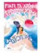
ΔΙΟΝΥΣΗΣ ΣΑΒΒΟΠΟΥΛΟΣ Γιατί τα χρόνια τρέχουν χύμα Σελ. 336 Εκδόσεις Πατάκη