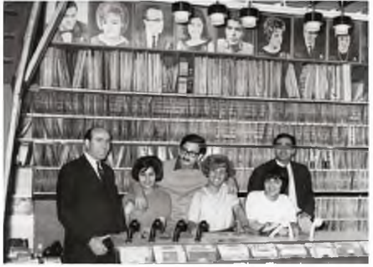
«ΜΑΡΤΙΟΣ 1965. ΜΟΛΙΣ ΒΗΚΕ ΤΟ ΠΡΩΤΟ ΜΟΥ 45ΑΡΙ, ΦΩΤΟΓΡΑΦΗΘΗΚΑ ΣΤΟ ΔΙΣΚΑΔΙΚΟ 'ΤΑΣΙΔΗΣ' ΜΕ ΤΟ ΠΡΩΣΩΠΙΚΟ. ΑΠΟ ΠΑΝΩ ΜΕ ΚΟΙΤΟΥΝΕ ΤΑ ΕΙΔΩΛΑ»