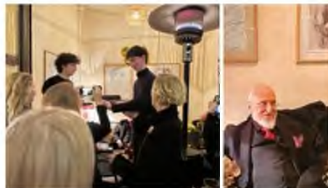
2024, ΣΤΑ ΟΓΔΟΗΚΟΣΙΑ ΤΟΥ ΓΕΝΕΘΛΙΑ