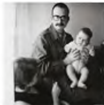
«ΕΞΩ, ΜΕ ΤΡΕΛΟΧΑΡΤΟ ΚΑΙ ΤΟ ΚΟΡΝΗΛΑΚΙ ΜΟΥ ΑΓΚΑΛΙΑ»