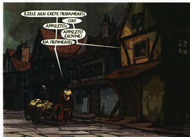
Σχέδια από τον Ιεροεξεταστή του Αρκά.

ροχής της δύναμης έναντι του δικαίου ή της δεισιδαιμονίας έναντι του ορθολογισμού.