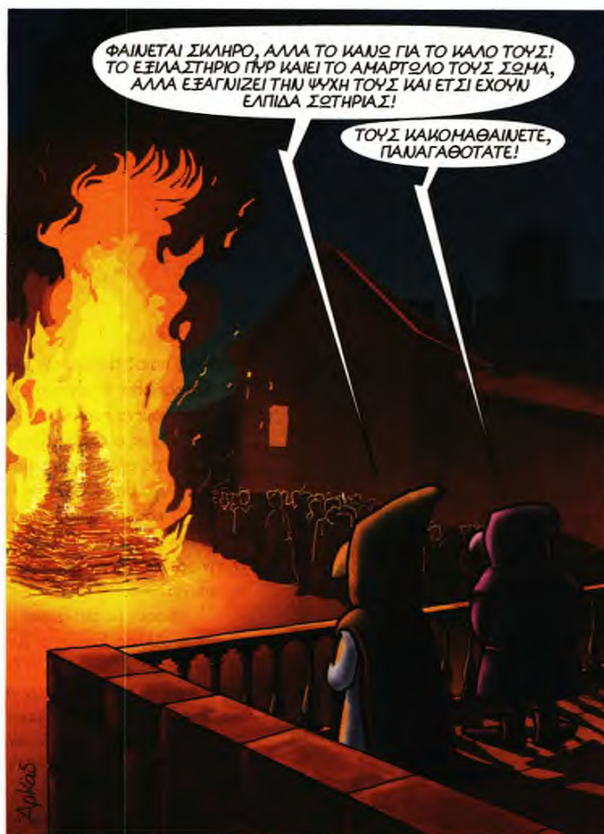
Σχέδιο από τον Ιεροεξεταστή του Αρκά.

Από τις ελάχιστες τελεσφόρες προσφορές καταφυγίου σε διωκόμενους είναι αυτή στη Μονή Αγίου Παύλου εκτός των Τειχών, το 1944 (σ. 414-432). Αλλά εκείνοι που προστατεύτηκαν, μετά από μια παραχώδη νύχτα ερευνών και ανακρίσεων των μοναχών από ιταλούς φασίστες αστυνομικούς, ήταν κατά πλειονότητα αποστάτες του μωσολινικού καθεστώτος! Παρά ταύτα, ο Γγκς επικαλείται το επεισόδιο με την εντύπωση ότι αποδεικνύει, έτσι, πως: «Η πόρτα της Αγίας Έδρας είναι ανοιχτή για οποιοδήποτε βρίσκεται σε ανάγκη». Νωρίτερα πάντως, σε δυο κεφάλαια με κοινό τίτλο «Ιστορία ζωφρών και μαύρων τόπων της Ανατολής» (σ. 265-341), μετά τις αναφορές σε μαρτυρίες που βεβαίωσαν με φωτογραφίες και σχεδιαγράμματα τι είδους λειτουρ-