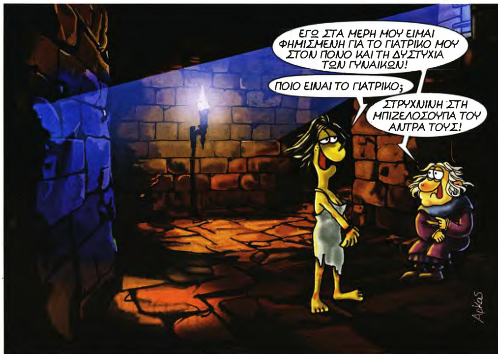
Σχέδιο από τον Ιεροξεταστή του Αρκά.

Δεν υπάρχει αμφιβολία ότι ο Ιγκς κατέβαλε «τιτάνια» προσπάθεια για να χειριστεί ένα ογκώδες ιστορικό υλικό. Οι 841 σημειώσεις στις τελευταίες 45 σελίδες το δείχνουν. Αλλά