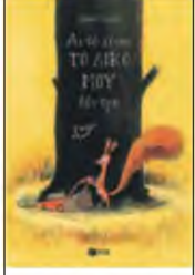
ΟΛΙΒΙΕ ΤΑΛΕΚ Αυτό είναι ΤΟ ΔΙΚΟ ΜΟΥ ΔΕΝΤΡΟ ΕΚΔΟΣΕΙΣ ΠΑΤΑΚΗ, 2024