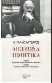
ΜΙΧΑΛΗΣ ΚΑΤΣΑΡΟΣ Μείζωνα Ποιητικά Επιμέλεια: Άρης Μαραγκόπουλος ΕΚΔΟΣΕΙΣ ΤΟΠΟΣ, 2018