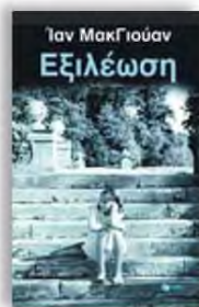
«Εξιλέωση» Ιαν ΜακΓιούαν Μετάφραση: Γιάννης Σκαρθέλος, εκδόσεις Πατάκης

Το βιβλίο έγινε γνωστό από την ταινία με την Κίρα Νάιτ και επανεκδόθηκε φέτος στα ελληνικά: η Βρετανίδα Μπράιον Τάλις διηγείται την παράνομη ιστορία αγάπης της αδελφής της Σσεσίλια, με τον γιο του οικονομίου, Ρόμπι Τέρνερ, λίγο πριν ξεκινήσει ο Β' Παγκόσμιος Πόλεμος και τον αγώνα τους να βρουν ξανά ο ένας τον άλλο. Είναι όμως όλα όπως φαίνονται; Υπάρχουν γεγονότα και υπάρχουν ιστορίες. Αυτές μπορούν να ξαναγραφτούν, με αισιοδοξία και διάθεση, ειδικά αν αποφασίσεις να το κάνεις στα πενήντα. Δύο μόνο προϋποθέσεις απαιτούνται: να έχει καταλάβει τι έχεις κάνει λάθος και να είσαι έτοιμος για μια νέα αρχή, με κλειστούς λογαριασμούς. Εξιλέωση, όπως rebranding.