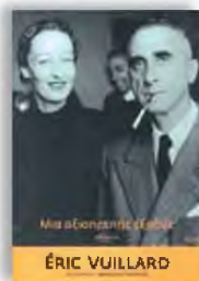
«Μια αξιοπρεπής έξοδος» Eric Vuillard Μετάφραση: Μανώλης Πιμηλής, εκδόσεις Πόλις

Υπήρξε μια εποχή, στις αρχές του 19 ου αιώνα, που στη Γαλλία πίστευαν πως τίποτα δεν θα διατάρασε την ηγεμονία τους στις αποικίες της Ινδοκίνας. Ήταν απολύτως βέβαιοι για την κυριαρχία τους, παρά τη σταδιακή συνειδητοποίηση των κατοίκων όχι μόνο για τη διαπλοκή και τη διαφθορά, αλλά και για τον κόσμο που άλλαζε μέρα με τη μέρα. Στο τέλος, το μόνο που τους απέμενε πια να κάνουν ήταν να αποχωρήσουν αξιοπρεπώς, για να μη φανεί πως έχασαν. Από ποιον; Από εκείνους που έμοιαζαν αδύναμοι στη σκακιέρα, όμως τελικά κέρδισαν τον «παλιό τρόπο» που γίνονταν τα πράγματα. Στις γαλάζιες αποικίες ανέκαθεν μιλούσαν γαλλικά - αν και το τέλος μάλλον δεν το έχουμε δει ακόμα.