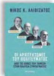
«Μαυροκορδάτος, Τρικούπης, Βενιζέλος, Καραμανλής: οι αρχιτέκτονες του πολιτεύματος» Νίκος Κ. Αλιβιζάτος Εκδόσεις Μιτάιχιμο

Η ζωή μιας διπλωμάτισσας, όπως η ηρωίδα της Γερμανίδας Λούσι Φρίκε που μετατίθεται από το Μοντεβιδέο στην Κωνσταντινούπολη ύστερα από μια αποτυχημένη αποστολή, διεξάγεται μισή στο προσκήνιο, μισή στο παρασκήνιο. Το ίδιο συμβαίνει με μια Πρόεδρο της Δημοκρατίας, για την οποία κάθε εθιμοτυπική κίνηση κρύβει διαβουλεύσεις που ποτέ δεν γίνονται γνωστές. Και οι δύο χρειάζονται επιμονή και υπομονή, χαρακτηριστικά απολύτως σημαντικά τόσο για μια αποστολή σε διακεκαυμένη ζώνη όσο και για την αναμονή μιας ανακοίνωσης που δεν μπορεί να ελέγξει κανείς, παρά μόνο εκείνος που την παίρνει. Και οι δύο, στο τέλος, κάνουν τη δουλειά τους με τον δικό τους τρόπο, γνωρίζοντας πως αυτός μπορεί να μην αρέσει σε όλους.