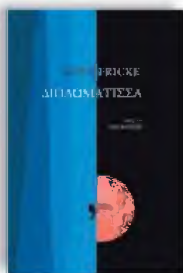
«Η διπλωμάτισσα» Lucy Fricke Μετάφραση: Τέο Βότσος, εκδόσεις Κείμενα

Η ζωή μιας διπλωμάτισσας, όπως η ηρωίδα της Γερμανίδας Λούσι Φρίκε που μετατίθεται από το Μοντεβιδέο στην Κωνσταντινούπολη ύστερα από μια αποτυχημένη αποστολή, διεξάγεται μισή στο προσκήνιο, μισή στο παρασκήνιο. Το ίδιο συμβαίνει με μια Πρόεδρο της Δημοκρατίας, για την οποία κάθε εθιμοτυπική κίνηση κρύβει διαβουλεύσεις που ποτέ δεν γίνονται γνωστές. Και οι δύο χρειάζονται επιμονή και υπομονή, χαρακτηριστικά απολύτως σημαντικά τόσο για μια αποστολή σε διακεκαυμένη ζώνη όσο και για την αναμονή μιας ανακοίνωσης που δεν μπορεί να ελέγξει κανείς, παρά μόνο εκείνος που την παίρνει. Και οι δύο, στο τέλος, κάνουν τη δουλειά τους με τον δικό τους τρόπο, γνωρίζοντας πως αυτός μπορεί να μην αρέσει σε όλους.