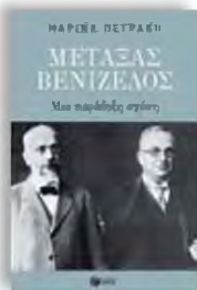
«Μεταξάς - Βενιζέλος, μια παράδοξη σχέση» Μαρίνα Πετρόκη Εκδόσεις Πατάκης

Τι ένωσε τον Ιωάννη Μεταξά και τον Ελευθέριο Βενιζέλο; Αν ρωτήσει κανείς οποιοδήποτε μέλος του Κομμουνιστικού Κόμματος, η απάντηση είναι μία και είναι γραμμένη στην ιστορία του ΚΚΕ με τρόπο ανεξίτηλο. Πώς όμως συναντήθηκαν οι δρόμοι τους; Γιατί συγκρούστηκαν μετωπικά; Τι ήταν αυτό που τους ένωσε και στο τέλος αυτό που τους χώρισε οριστικά; Η μελέτη του αντιπάλου δεν μπορεί να μένει στο «όλοι ίδιοι είναι», γιατί τότε είναι ελλιπής. Ασε που μέσα από μια παράδοση, αντικομμουνιστική σχέση, περιγράφεται και μια ολόκληρη εποχή, που κάποιος λένε ότι σε διεθνές επίπεδο μοιάζει πολύ με όσα έρχονται.