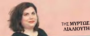
THE ΜΥΡΤΩΣ ΛΙΑΛΙΟΥΤΗ

Οι γιορτές είναι ευκαιρία για ανασκόπηση, χαλάρωση και λίγο διάβασμα. Γι' αυτό «ΤΑ ΝΕΑ» προτείνουν σε δέκα πολιτικά πρόσωπα από ένα ανάγνωσμα που ίσως θα τους ταίριαζε