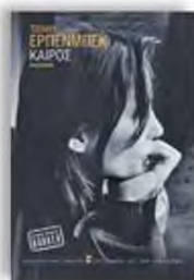
«Καίρος» Τζένιυ Ερπενμπεκ Μετάφραση: Αλέξανδρος Κυπριώτης, εκδόσεις Κοστανιώτης

Εκείνη είναι 19 ετών, εκείνος 34 χρόνια μεγαλύτερός της. Ερωτεύονται στο ανατολικό Βερολίνο, χωρίζουν στο ενωμένο. Η Ερπενμπεκ μιλάει συμβολικά για μια από τις πιο θετικές στιγμές της σύγχρονης ιστορίας, χαραγμένη στα βιβλία, χωρίς να κρύβει τίποτα κάτω από το χαλί: τη βιασύνη και τα λάθη, το ενοχικό παρελθόν, την ανατροπή της σταθερότητας και την επόμενη μέρα σε έναν αβέβαιο κόσμο. Τι συμβαίνει όταν κάποιος ξέρει πως πρέπει να προχωρήσει, αλλά δεν ξέρει αν θέλει ή πώς να το κάνει; Πότε είναι η σωστή ώρα να χωριστείς και πότε πρέπει να πεις «να» σε ένα νέο μέλλον; Πότε και πώς λιτρώνεται κανείς από την τοξικότητα; Τα ερωτήματα στον Καιρό δεν είναι μόνο προσωπικά.