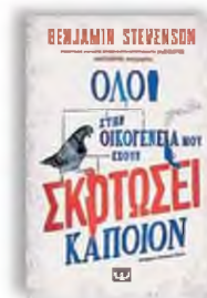
«Όλοι στην οικογένειά μου έχουν σκοτώσει κάποιον» Μπέντζαμιν Στίβενσον Μετάφραση: Αύγουστος Κορτώ, εκδόσεις Ψυχογιός

Ενας πολιτικός που αυτοπροσδιορίζεται φιλελεύθερος, όπως ο Κυριάκος Μητσοτάκης, έχει προφανώς διαβάσει πολύ για τέσσερις άντρες που προηγήθηκαν από αυτόν και διαμόρφωσαν καθοριστικά το ελληνικό κράτος, και μεταξύ άλλων διαμορφώνουν την ιστορία του ελληνικού πολιτικού κέντρου: Αλέξανδρος Μαυροκορδάτος, Χαρίλαος Τρικούπης, Ελευθέριος Βενιζέλος, Κωνσταντίνος Καραμανλής. Η συνύπαρξή τους στο ίδιο βιβλίο επιτρέπει ευρύτερα ερωτήματα: ποια είναι τα όρια ενός πολιτικού που πρέπει να συνθέσει, αλλά διαφωνεί «με την πλευρά του»; Ποια είναι η αξία ενός κανονικού δικομματισμού αντί μιας κακεκτικτής καρικατούρας; Ποια οφείλει να είναι η σχέση της εκτελεστικής με τη δικαστική εξουσία; Και, τελικά, πόσες κινήσεις και επιλογές απαιτούνται για να εξασφαλιστεί η υστεροφημία του;