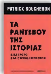
«Τα ραντεβού της ιστορίας, δέκα τρόποι δημιουργίας γεγονότων» Patrick Boucheron Μετάφραση: Γιώργος Καράμπελας, εκδόσεις Πόλις

«Υπάρχουν στιγμές που νιώθουμε μέσα μας τη ρωγμή του χρόνου, αυτό που χωρίζει καθαρά το πριν από το μετά» λέει στο οπισθόφυλλο του βιβλίου του Patrick Boucheron. Υπάρχει πολιτικός που μπορεί να ταυτιστεί περισσότερο με αυτή τη φράση από τον Νίκο Ανδρουλάκη, του οποίου η διαδρομή χωρίζεται μεταξύ του πριν και του μετά τις εσωκομματικές εκλογές του ΠΑΣΟΚ; Από εδώ και πέρα, το ΠΑΣΟΚ και ο ίδιος έχουν μόνο μια δουλειά: να δημιουργήσουν γεγονότα που θα διαμορφώσουν το νέο δικομματικό τοπίο. Οι κινήσεις δεν είναι πάντα πετυχημένες, βέβαια. Ακόμα κι αν μιλάμε για τα ελληνικά δεδομένα, τι πιο έξυπνο από το να διαβάσεις πού πέτυχαν και πού απέτυχαν άλλοι, για να ξέρεις πού θα κινήσεις;