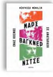
«Μαρξ, Βάγκνερ, Νίτσε: ένας κόσμος σε αναταραχή» Χέρφριντ Μίνκλερ Μετάφραση: Ερη Βοϊκούση, εκδόσεις Διόπτρα

Καρλ Μαρξ, Ρίχαρντ Βάγκνερ, Φρίντριχ Νίτσε: τρεις κορυφαίοι γερμανοί στοχαστές του 19 ου αιώνα, που οι τρόποι σκέψης τους άλλοτε συναντιούνται και άλλοτε απομακρύνονται, μελετούνται παράλληλα από τον Μίνκλερ, περιγράφοντας στην πραγματικότητα μια ολόκληρη εποχή που έφερε όχι έναν, αλλά δύο Παγκόσμιους Πολέμους. Μια περίοδο πολυκρίσεων, δηλαδή, που ενδεχομένως μοιάζει με τη σημερινή. Το βιβλίο είναι μεγάλο και δύσκολο, μιάζει για τρεις παρεξηγημένες προσωπικότητες, που γεύτηκαν πάθη στους σύγχρονους και τους μεταγενέστερους, αλλά όσοι το φτάσουν ως το τέλος γνωρίζουν λίγο καλύτερα την ιστορία της Γερμανίας. Και, ενδεχομένως, όσο ξανάρχονται ως τραγωδία ή ως φάρσα.