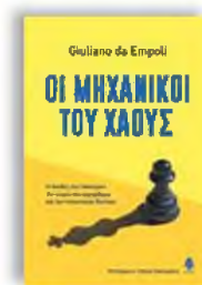
«Οι μηχανικοί του χάους» Giuliano da Empoli Μετάφραση: Μαρία Μολαφρέκα, εκδόσεις Κέδρος

Τι σημαίνει λαϊκισμός σήμερα; Ας πούμε πως ένας αρχηγός κόμματος πετάει μια γκάρφα στον αέρα - και δεν μπορεί να τη διορθώσει. Από την ώρα που την εκτομίζει, δεν ανήκει πια στον ίδιο: είναι η σειρά της επικοινωνίας της νέας εποχής, με τη βοήθεια των μάγων της επικοινωνίας, να αλλάξουν την οπτική των ψηφοφόρων. Τα ελαττώματα είναι προτερήματα, η απειρία είναι αντισυστημική, οι ελλείψεις αυθεντικότητα. Η μήπως το ανάποδο; Όταν ένας πολιτικός βασίζεται περισσότερο στη δική του απήχηση και λιγότερο στην παραδοσιακή κομματική δομή, τότε πρέπει να ξέρει τι κρύβεται πίσω από τον σχηματισμό ενός δημόσιου προφίλ το σωτήριο έτος 2025.