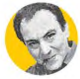
ΤΟΥ ΣΠΥΡΟΥ ΜΑΝΟΥΣΙΕΛΑ