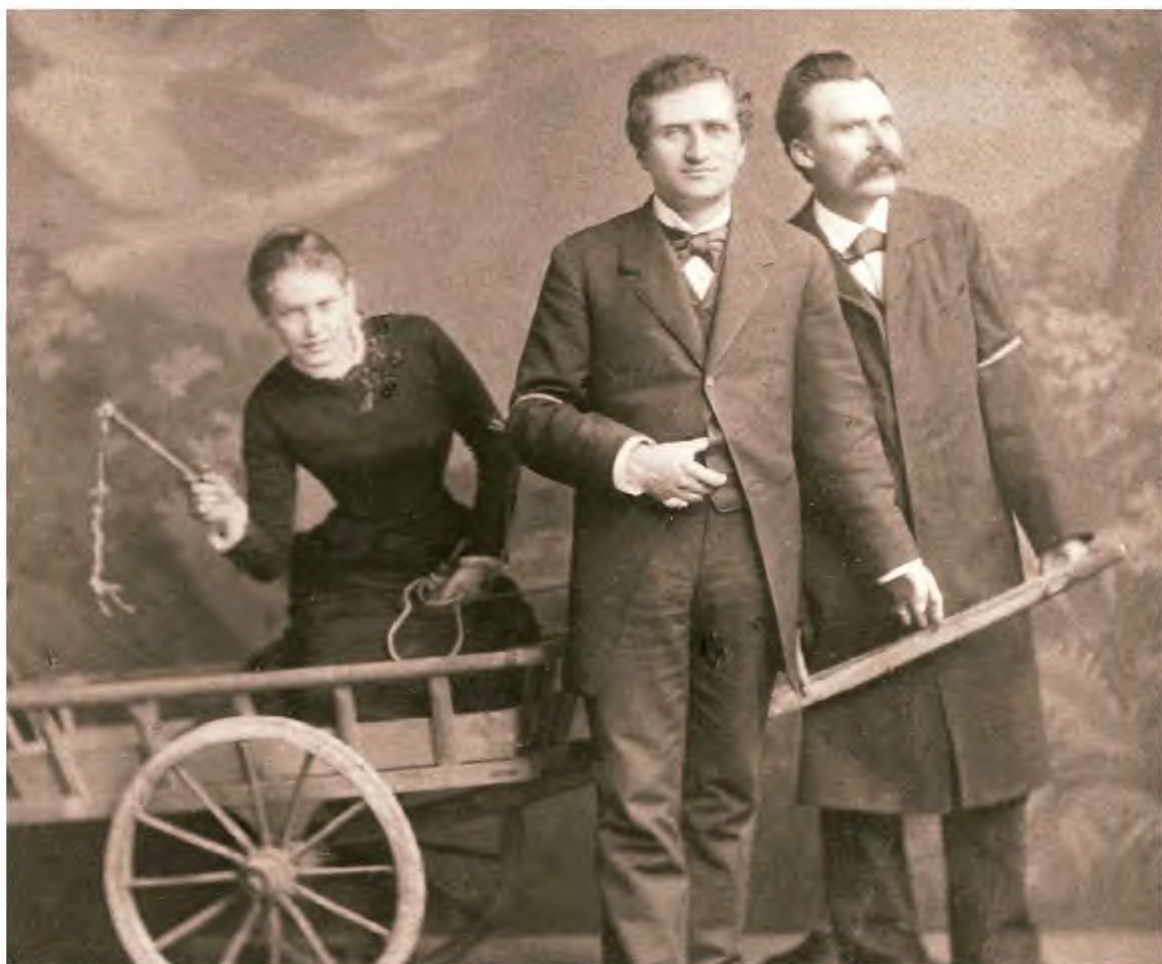
Η Λου Σαλομέ, ο Πάουλ Ρέε και ο Φρίντριχ Νίτσε πόζαρον για μια σκηνοθετημένη, παιγνιώδη φωτογραφία που αργότερα έγινε διάσημη. Ελβετία, 1882.

Δεν αδικεί διόλου το βιβλίο, αυτή την υποδειγματική βιογραφία του Φρίντριχ Νίτσε, το γεγονός ότι ξεκινάμε την παρουσίαση από ένα τέτοιο ανεκδοτολογικό περιστατικό. Αλλάστε ο μισογυνισμός δεν ήταν η μόνη από τις κατηγορίες που εισέπραξε ο Νίτσε και αμαύρωσαν τη φήμη του. Όμως η Αγγλονορβηγική συγγραφέας Σου Πριντό, έμπειρη βιογράφος και βραβευμένη για τις προσωπικές του Εντβαρντ Μουνκ και του Αυγούστου Στρίντμπεργκ, δεν γράφει ένα σοβαροφανές βιβλίο.