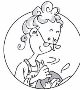
Η ΑΛΛΗ ΓΙΑΓΙΑ