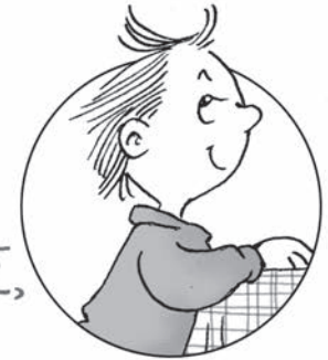
Ο ΝΕΣΤΟΡΑΣ, ΤΟ ΑΔΕΛΦΑΚΙ-ΔΙΑΒΟΛΑΚΙ