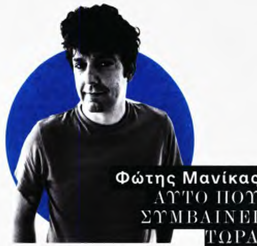
Φώτης Μανίκας ΑΥΤΟ ΠΟΥ ΣΥΜΒΑΙΝΕΙ ΤΩΡΑ

Στα 18 διηγήματα της συλλογής Δεν θυμάμαι να υπήρχε κάποια πόρτα κοντά μου , συναντάμε ανθρώπους της διπλανής πόρτας. Υπάρχει λόγος γι' αυτό;