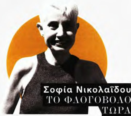
Σοφία Νικολαΐδου ΤΟ ΦΛΟΓΟΒΟΛΟ ΤΩΡΑ

Διαβάζω έντυπα βιβλία (μου αρέσει να σημειώνω με το μολύβι), ξαπλώνω συνήθως στον καναπέ ή σε μικρά καφέ (δεν με ενοχλεί ο θόρυβος), προτιμώ να διαβάζω με φυσικό φως, χωρίς να αποκλείω τη νύχτα που συχαίει το σπίτι και ο χρόνος διαστελλεται.