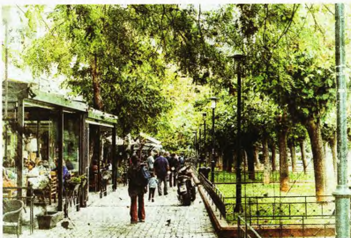
Η Φωκίωτος Νέγρη στην Κυψέλη, όπου διαδραματίζεται το τελευταίο βιβλίο του Χρήστου Χωμενίδη

Χ.Α. Χωμενίδης Ο ΤΖΙΜΗΣ ΣΤΗΝ ΚΥΨΕΛΗ (Πατάκης, 2021)