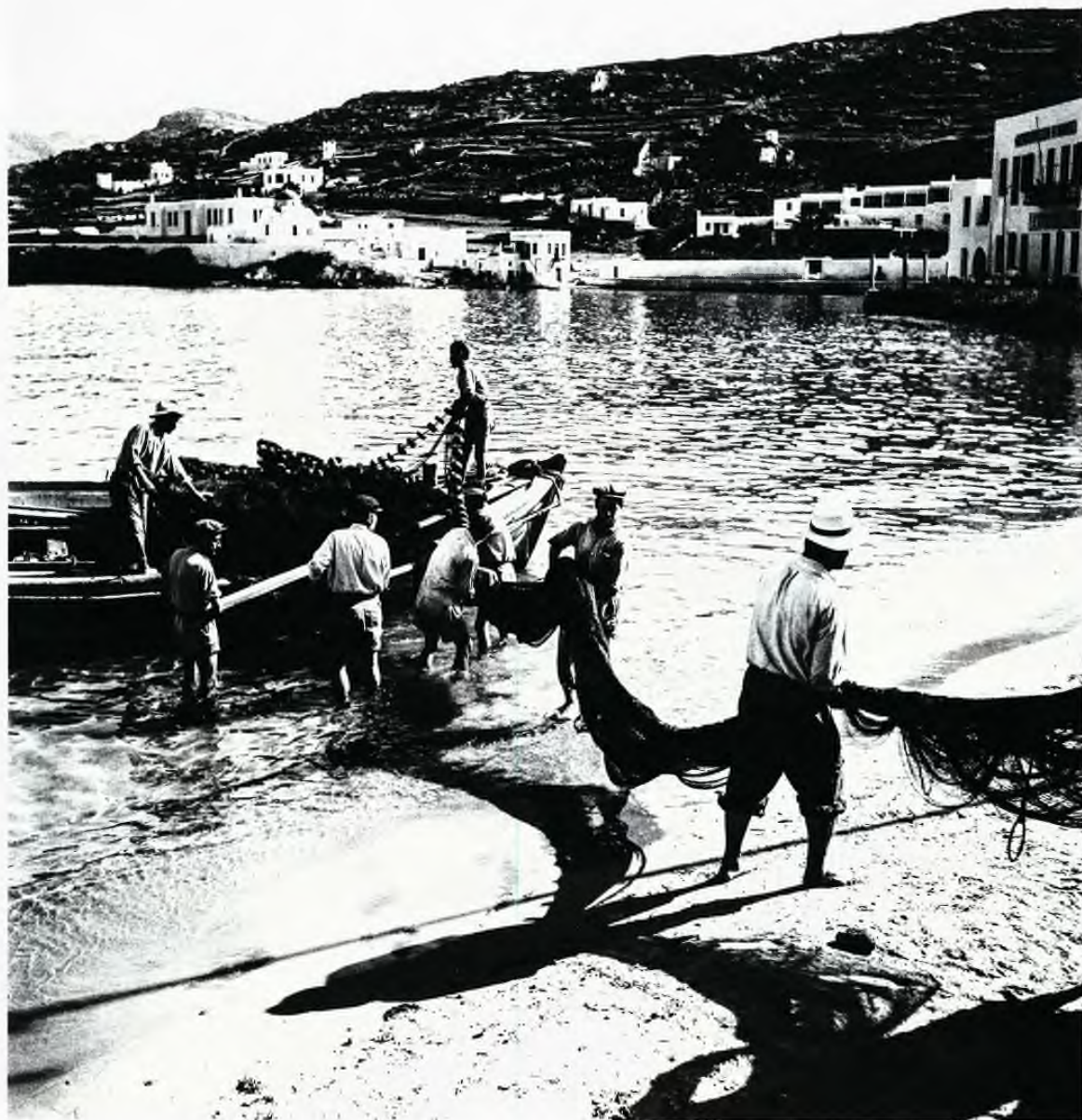
Μύκονος, 1955. Εημερώματα στον μώλο Καμπάνη, ψαράδες ξεφορτώνουν τα δίκτυα τους για στέγνωμα και επισκευή. Το νεόκτιστο Ξενοδοχείο «Λητώ» διαφαίνεται στο βάθος. Το «Λητώ» μαζί με το «Αμφιτρύων» στο Ναύπλιο ήταν τα πρώτα δύο ξενοδοχεία χτισμένα από τον ΕΟΤ το 1952.