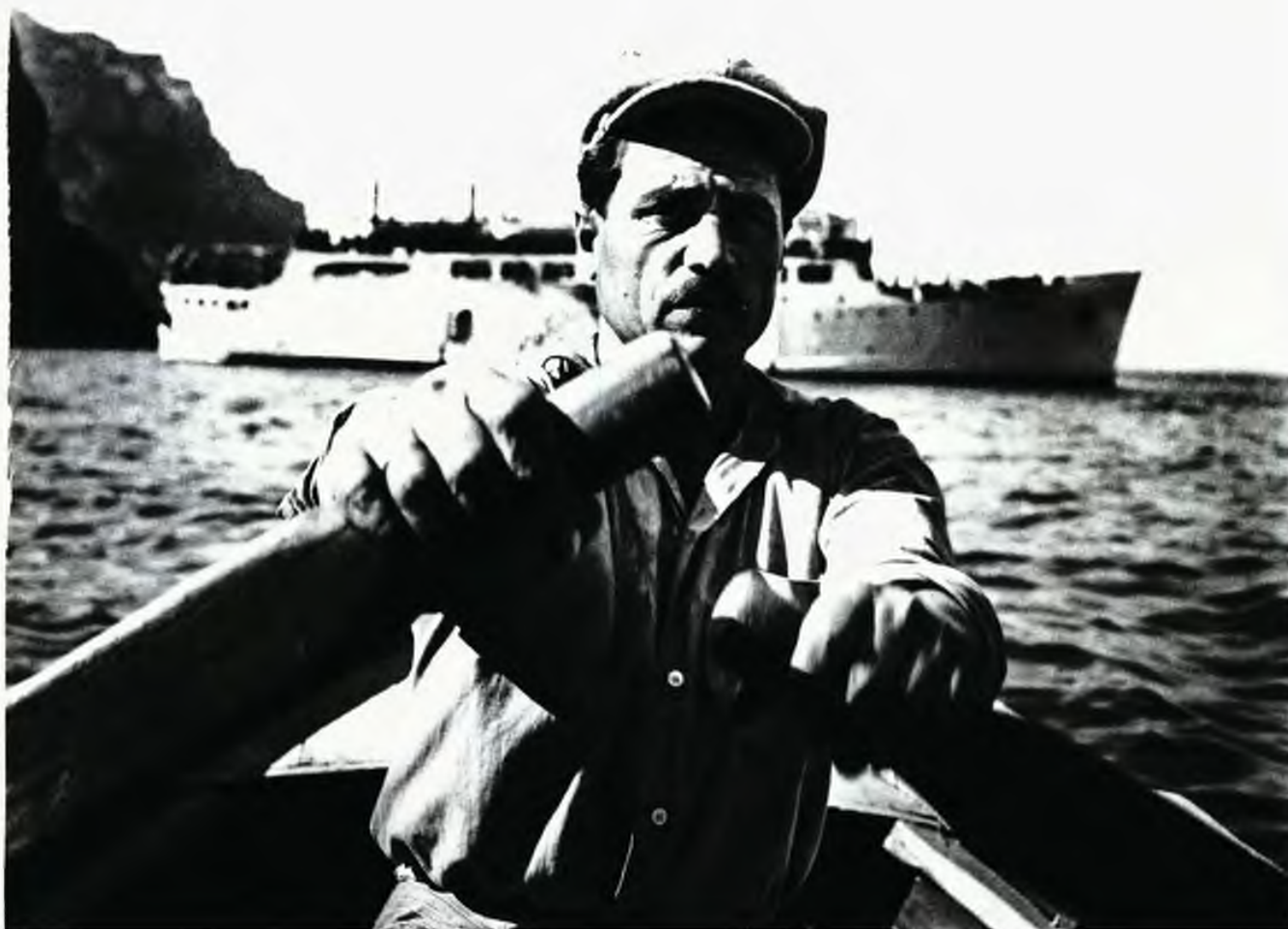
Σαντορίνη, 1960. Στη βάρκα πλησιάζοντας το «Δέσποινα».