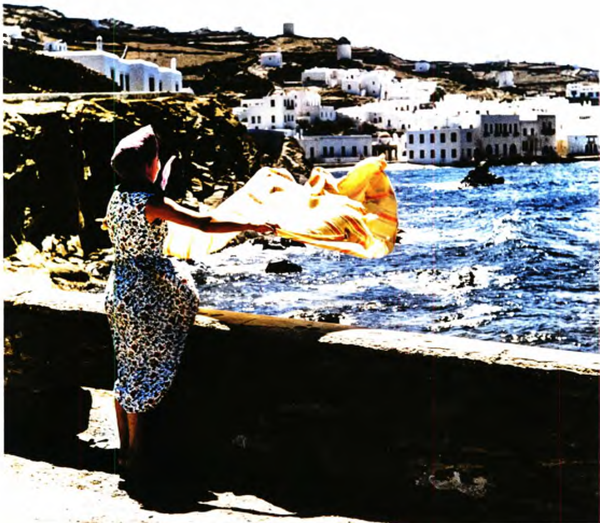
Μύκονος, 1957. Γυναίκα στεγνώνει τα ρούχα της στον αέρα και στον ήλιο. Πριν από τις σύγχρονες ηλεκτρικές οικιακές συσκευές αυτή η τεχνική ήταν πολύ αποτελεσματική.