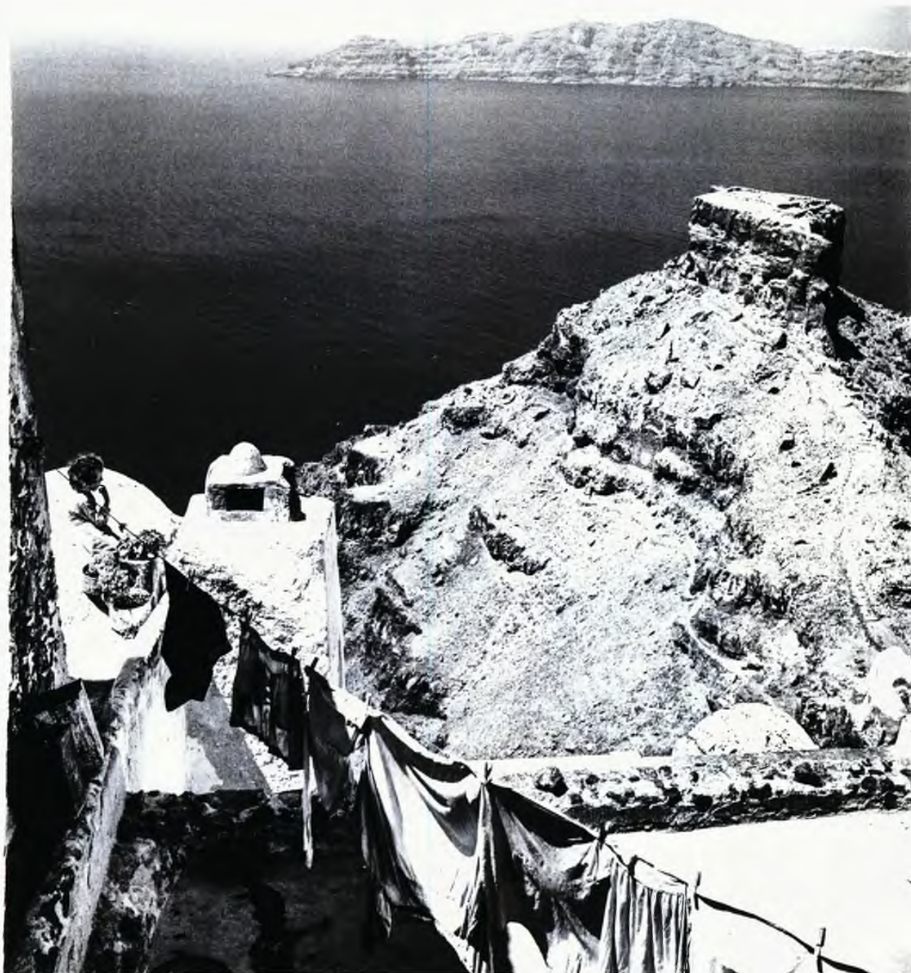
Μια νεαρή γυναίκα στα Φηρά με τη Θηρασιά στο βάθος. Ο μεγάλος βράχος ονομάζεται Σκάρος και ήταν η τοποθεσία μεσαιωνικού κάστρου και οικισμού προτού καταστραφεί από σεισμό.

©Robert McCabe (απο το βιβλίο «Σαντορίνη» με κείμενα της Μαργαρίτας Πουρνάρα).