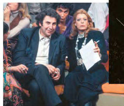
Με τη Μελίνα Μερκούρη στο Εξωτερικό, την περίοδο της δικτατορίας