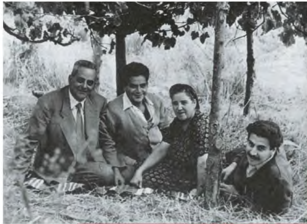
Η οικογένεια Θεοδωράκη στον Γαλατά της Κρήτης το 1954