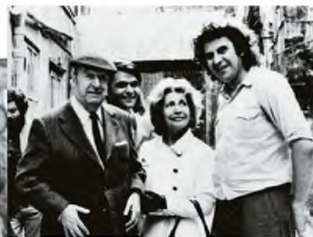
Αποθεωτική υποδοχή του Μίκη Θεοδωράκη μετά την επιστροφή του στην Ελλάδα το 1974 (αριστερά). Με τον Πάμπλο Νερούδα και τη σύζυγό του Ματίλντε στο Παρίσι, μετά από πρόβα για το «Canto General» (επάνω)