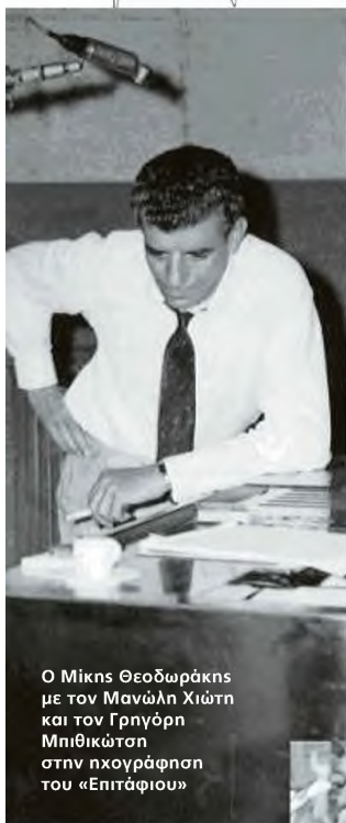
Ο Μίκης Θεοδωράκης με τον Μανώλη Χιώτη και τον Γρηγόρη Μπιθικώτση στην ηχογράφιση του «Επιτάφιου»

Παρίσι 1958. Ο φοιτητής Μίκης, περιμένοντας μέσα σε ένα πράσινο Opel τη Μυρτώ να γυρίσει από το μπακάλικο, διαβάζει κάποια ποιήματα που του έχει στείλει ο Γιάννης Ρίτσος από την Ελλάδα. Είναι ο εμβληματικός «Επιτάφιος» με τα «Μέρα Μαγισιά», «Να 'χα τ' αθάνατο νερό», «Πού πέταξε τ' αγόρι μου» κ.α. Ο ποιητής έχει ερμηνευτεί αυτούς τους στίχους χρόνια πριν, το 1936, όταν βλέπει στο εξώφυλλο του «Ριζοσπάστη» τη φωτογραφία μιας μάννας να θρηνεί πάνω από το άψυχο σώμα του παιδιού της. Ηταν ο Τάσος Τούσης, που έχασε τη ζωή του κατά τη διάρκεια απεργίας των καπνεργατών.