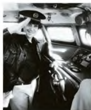
Οδηγώντας σκάφος στη λίμνη Βαϊκάλ

Ο Μίκης διηγείται χαρακτηριστικά: « Τη μέρα που γράφαμε τα τραγούδια του "Άξιον Εστί", στο στούντιο της Κολούμπια, θυμάμαι πως είχε έρθει κάποιο σχολείο κι εγώ είπα στα παιδιά να καθίσουν στο πάτωμα ήουκα-ήουκα να παρακολουθήσουν τη φωνοληψία. Οι άλλοι δεν ήθελαν από φόβο μήπως γίνουν θύρφοι, όμως εμένα μου άρεσε που το "Ένα το χελιδόνι" θα γραφόταν οριστικά πάνω στο δίσκο με φόντο την ανάσα και τα κινήματα της καρδιάς των παιδιών. Μπορεί να μην ακουγούνται, όμως ποιος δεν τα αισιάνεται...».