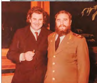
Με τον Φιντέλ Κάστρο στην Αθήνα