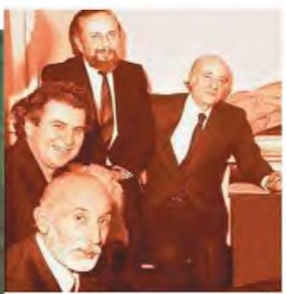
Με τον Οδυσσέα Ελύτη, τον Γιάννη Ρίτσο και τον Μάνο Κατράκη

χειραφία και ακαταπόντος μαζεύει τις βάλτσες του από το ξενοδοχείο και τραβεί για το αεροδρόμιο στο Σέδες.