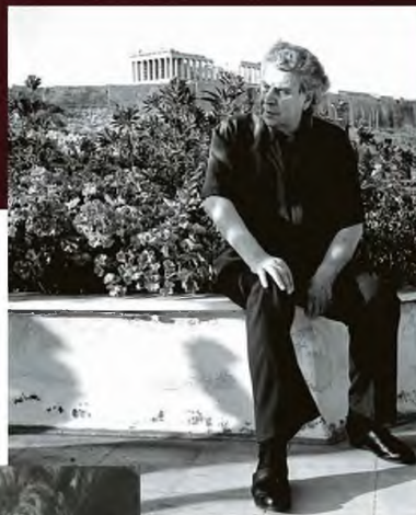
Ο Μίκης Θεοδωράκης φωτογραφίζεται με φόντο την Ακρόπολη. Κάτω με τον Γιάννη Ρίτσο

Τα άγνωστα γεγονότα της μουσικής και οι σπουδαίες προσωπικότητες με τις οποίες συνευρέθηκε ο Μίκης