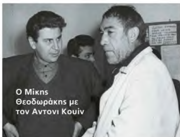
Ο Μίκης Θεοδωράκης με τον Αντώνη Κούφι