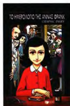
Το εξώφυλλο του εικονογραφημένου «Ημερολογίου της Άννας Φρανκ».

και εν τέλει δέχθηκε να γυρίσει την ταινία. «Κατάλαβα ότι για να διατηρηθεί ζωντανή η ιστορία της Άννας Φρανκ θα πρέπει να βρούμε πάντα νέους τρόπους για να την πούμε» τόνισε, «είτε αυτό θα είναι κινούμενο σχέδιο είτε γραφική νοβέλα. Το κινούμενο σχέδιο είναι εργαλείο εκπαίδευσης για το νεανικό κοινό. Αν ένα 2% των παιδιών που θα δουν την ταινία μου αναζητήσουν το ημερολόγιο, θα έχω κάνει μια καλή δουλειά» (παράλληλα με την ταινία, ο Φόλμαν δημοσίωσε μαζί με τον Νταβίτ Πολόνσκι το graphic diary «Το Ημερολόγιο της Άννας Φρανκ» - κυκλοφορεί στα ελληνικά