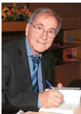
Ο γνωστός αστυνομικός ρεπόρτερ Πάνος Σόμπολοβ υπογράφει το βιβλίο που κυκλοφορεί από τις εκδόσεις Πατάκη

τρίτο φονικό όταν λίγη ώρα αργότερα βρέθηκε δολοφονημένος ένας ακόμη Βορζιζιανός, ο Μιχάλης Α., από πυροβόλο όπλο». Παρότι δεν υπήρχαν αυτόπτες μάρτυρες, όλα έδειχναν ότι επρόκειτο για χαρακτηριστική βεντέτα και παραπέμφθηκε σε δίκη ο Γιάννης Β., 54 χρόνων, κτηνοτρόφος, συγγενής του δράστη του πρώτου φονικού. Τα φονικά συνεχίστηκαν με τον πιο εσωφρενικό τρόπο, με τη χρήση χειροβομβίδας από την οποία σκοτώθηκαν τρεις και τραυματίστηκαν δεκατέσσερις. Η λεπτομέρεια είναι ότι ο Θεοκάρης, που είχε τη χειροβομβίδα στην τσέπη του, για να φτάσει στο σπίτι του νεκρού δασοφύλακα και να την εκσφενδον-