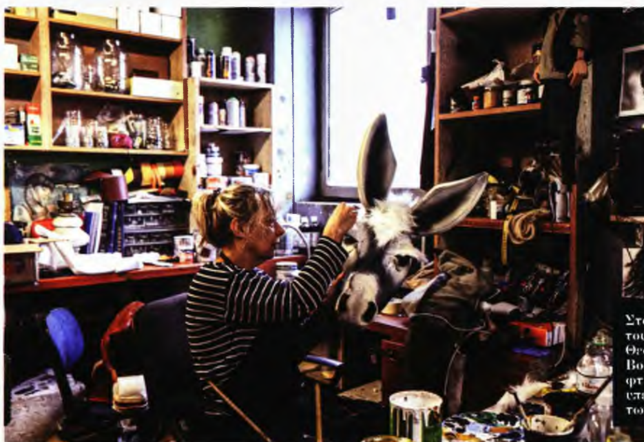
Στα εργαστήρια του Κρατικού Θεάτρου Βορείου Ελλάδος φτιάχτηκαν οι υπέροχες μάσκες των ζώων.