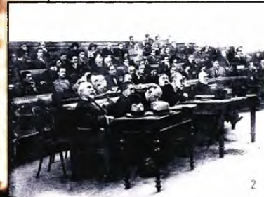
1. Η Σμύρνη καίγεται 2. Οι κατηγορούμενοι στην Δίκη των Έξι