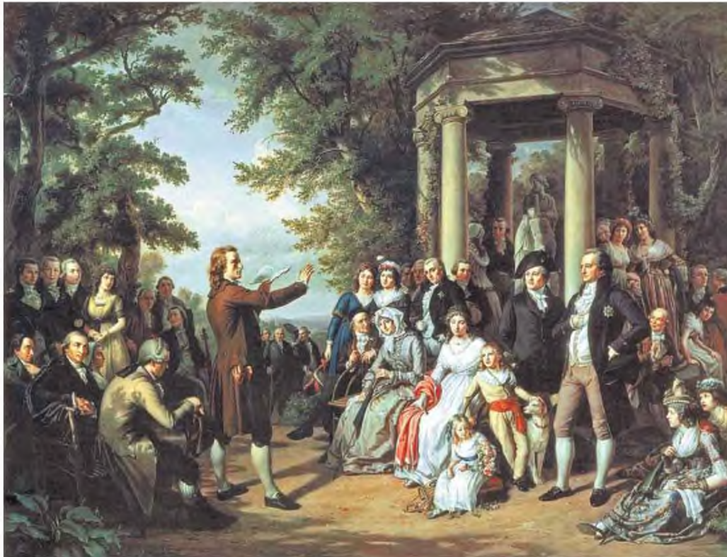
«Ο Σίλερ στην Αυλή των Μουσών της Βαϊμάρης», πίνακας του Τέομπάλντ φον Ερ (διακρίνονται και οι Γκαίτε, Χέρντερ)

Media: TA NEA ΣΑΒΒΑΤΟΚΥΡΙΑΚΟ Page: 73-74 Published at: 28-04-2023 Author: Surface: 1761.33 cm 2 Circulation: 24590 Subjects: