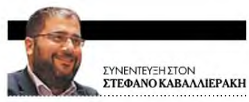
ΣΥΝΕΝΤΕΥΞΗ ΣΤΟΝ ΣΤΕΦΑΝΟ ΚΑΒΑΛΛΙΕΡΑΚΗ

Ο David Imhoof, καθηγητής Ιστορίας στο Πανεπιστήμιο Σασκουεχάνα των ΗΠΑ, συγγραφέας του βιβλίου «Αυτή είναι λοιπόν η Ευρώπη μας. Μια ιστορία από τον Διαφωτισμό έως σήμερα» (εκδ. Πατάκη, μτφ. Πέτρος Γεωργίου), δεν είναι αυτό που φανταζόμαστε ακριβώς για έναν πανεπιστημιακό καθηγητή. Εισαγείται μια νέα οπτική για την ιστορία της Ευρώπης, με βασικό άξονα τον Διαφωτισμό, αλλά χρησιμοποιώντας ένα άμεσο στυλ αφήγησης, συχνά μη πολιτικά ορθό λόγο, με παραδείγματα, με κάπως αιρετικό λόγο, αλλά