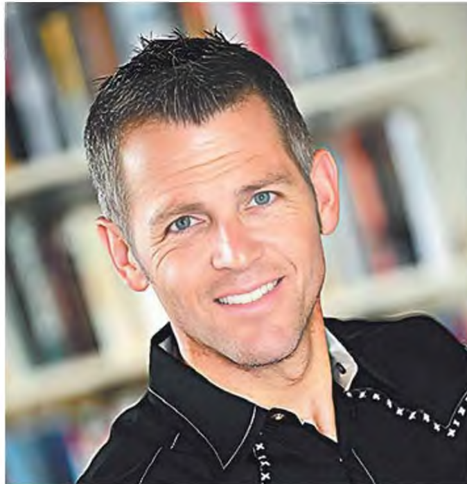
Ο ιστορικός Ντέιβιντ Ιμχοφ

Για τους φίλους μου με σπουδές στη Μεσαιωνική Ιστορία: αυτό που κάνετε μετράει, σας αγαπάμε. Για τους λάτρεις του 19ου αιώνα, την εποχή των επαναστάσεων: προχωρήστε, ποιος τελικά δεν αγαπά μια καλή επανάσταση; Αλλά