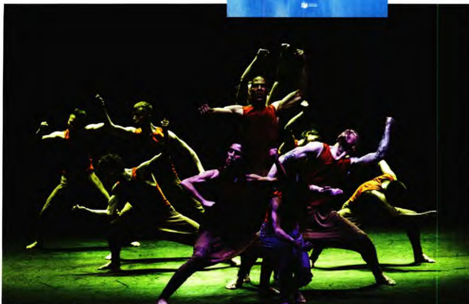
ΑΠΟ ΕΠΑΝΩ: Η ROSALÍA, ΤΟ ΒΙΒΛΙΟ ΤΗΣ ΑΛΕΞΑΝΔΡΑΣ Κ* ΚΑΙ ΣΚΗΝΗ ΑΠΟ ΤΗΝ ΠΑΡΑΣΤΑΣΗ JUNGLE BOOK REIMAGINED ΤΟΥ AKRAM KHAN.