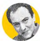
ΤΟΥ ΣΠΥΡΟΥ ΜΑΝΟΥΣΣΕΛΗ