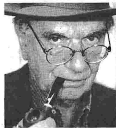
Ο Βασίλης Βασιλικός