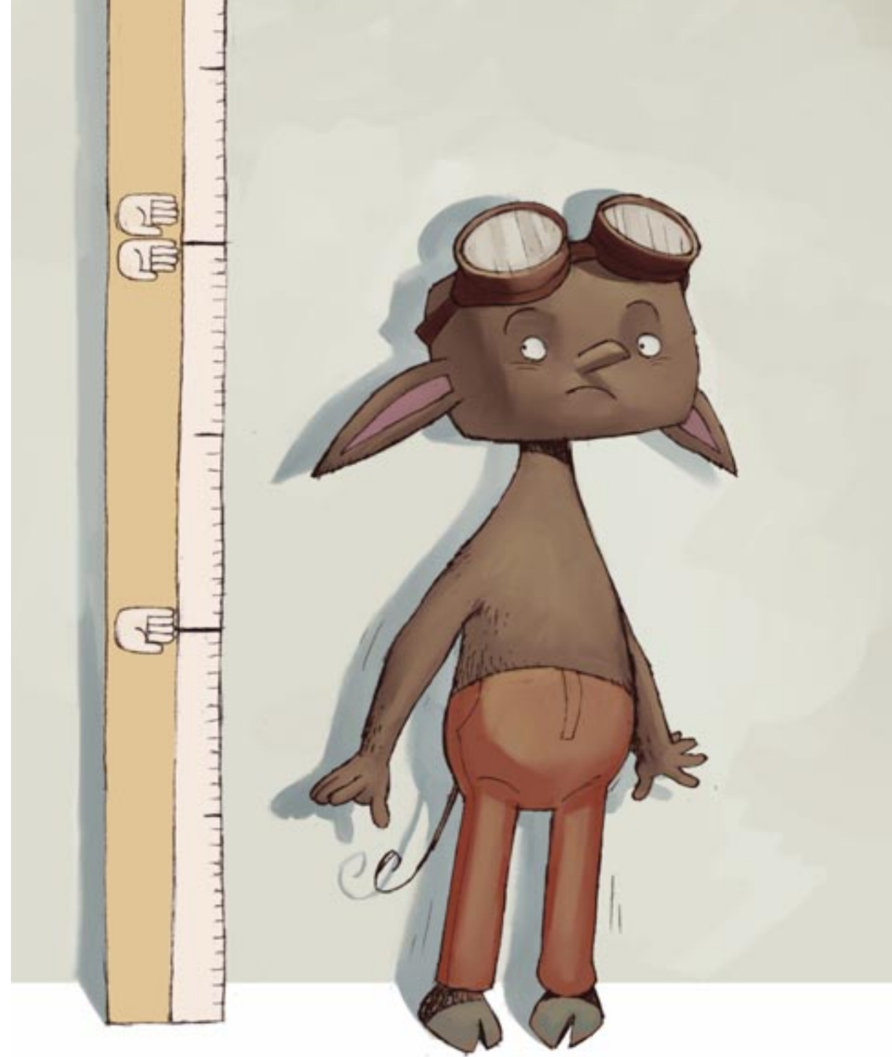
Ο Νείθαν σε φυσικό μέγεθος

«Χάλασε ο κόσμος. Κάποτε το να ήσουνα κοντός ήταν προτέρημα. Κοντός και γρήγορος, λέγαμε. Ψηλός και άχαρος. Μωρέ, τι θέλετε να το κάνετε το παιδί; Τέρας; Ακόμα λίγο να ψηλώσει και θα μοιάζει —φτου φτου, μακριά από μας!— με τον... ακατονόμαστο».