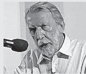
Luis Razeto Migliaro

Ο Χιλιανός κοινωνιολόγος και καθηγητής Φιλοσοφίας Luis Razeto Migliaro γεννήθηκε το 1945. Διατέλεσε καθηγητής και διευθυντής του Τμήματος Κοινωνικών Επιστημών στο Πανεπιστήμιο της Χιλής, καθηγητής στο Facoltà di Scienze Statistiche ed Attuariali, Università degli Studi di Roma, Italia, καθηγητής στη Σχολή Μηχανικών του Πανεπιστημίου της Χιλής, καθώς και γενικός διευθυντής του Πανεπιστημίου Bolivarian της Χιλής. Το 2009 τιμήθηκε από την DANCOSIAL της Κολομβίας για την προσφορά του στην αλληλέγγυα οικονομία και το 2017 τιμήθηκε από το CIESCOOP για την καριέρα του στην κοινωνική και αλληλέγγυα οικονομία.