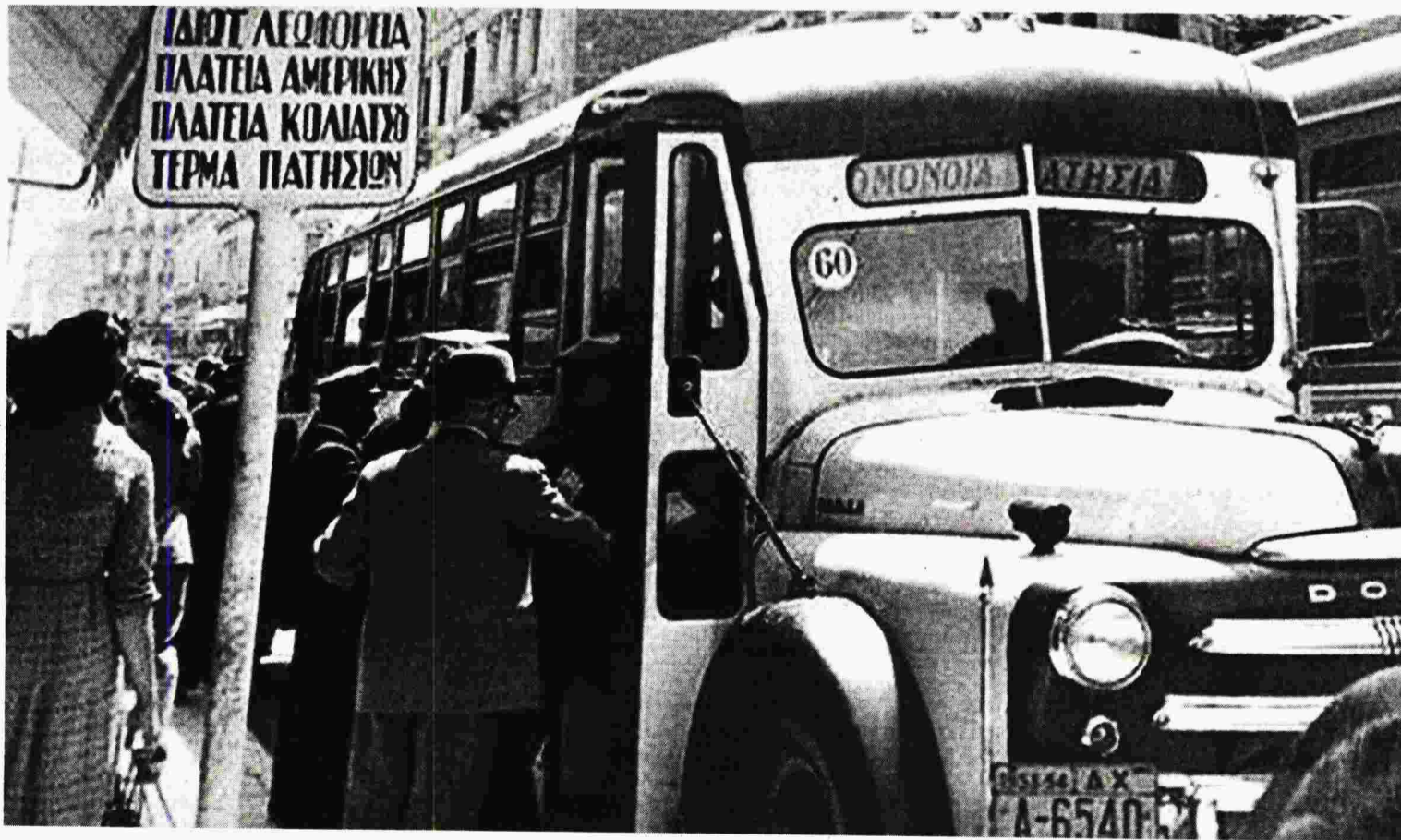
Στιγμιότυπο από την Κυψέλη του 1960, όπου εκτυλίσσεται μέρος του μυθιστορήματος